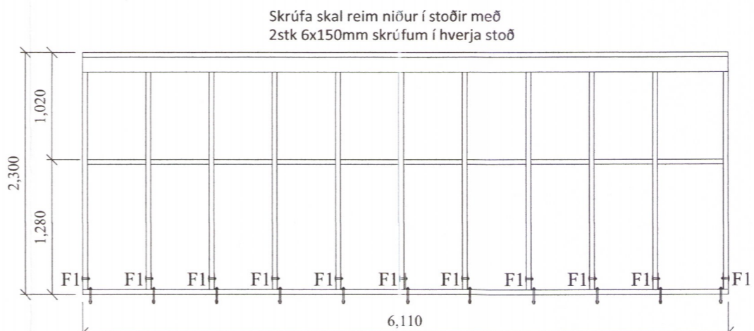
Grind nr. 2 - 45x145mm grindaefni