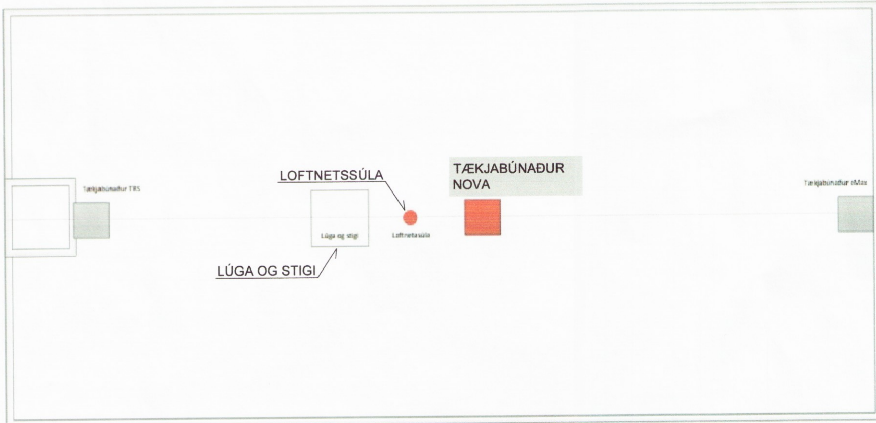
STAÐSETNING TÆKJA NOVA Á GRUNNMYND ÞAKRÝMIS (ÁN MKV.)