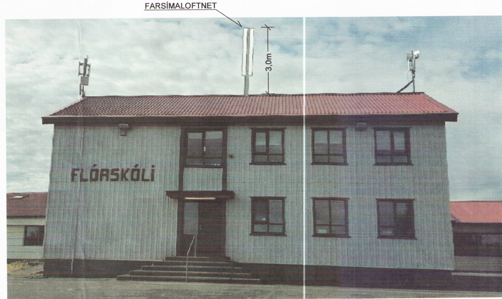
STAÐSETNING TÆKJA NOVA Á LJÓSMYND (ÁN MKV.)