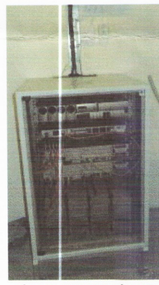
ÚTLIT SENDIS (ÁN MKV.)