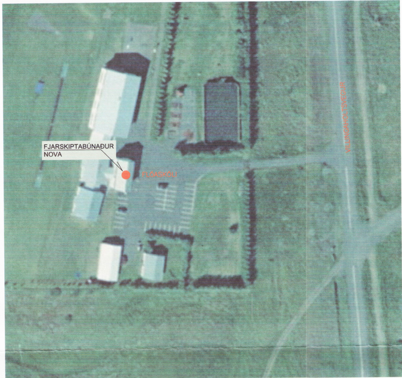
AFSTÖÐUMYND AF FLÓASKÓLA (ÁN MKV.)