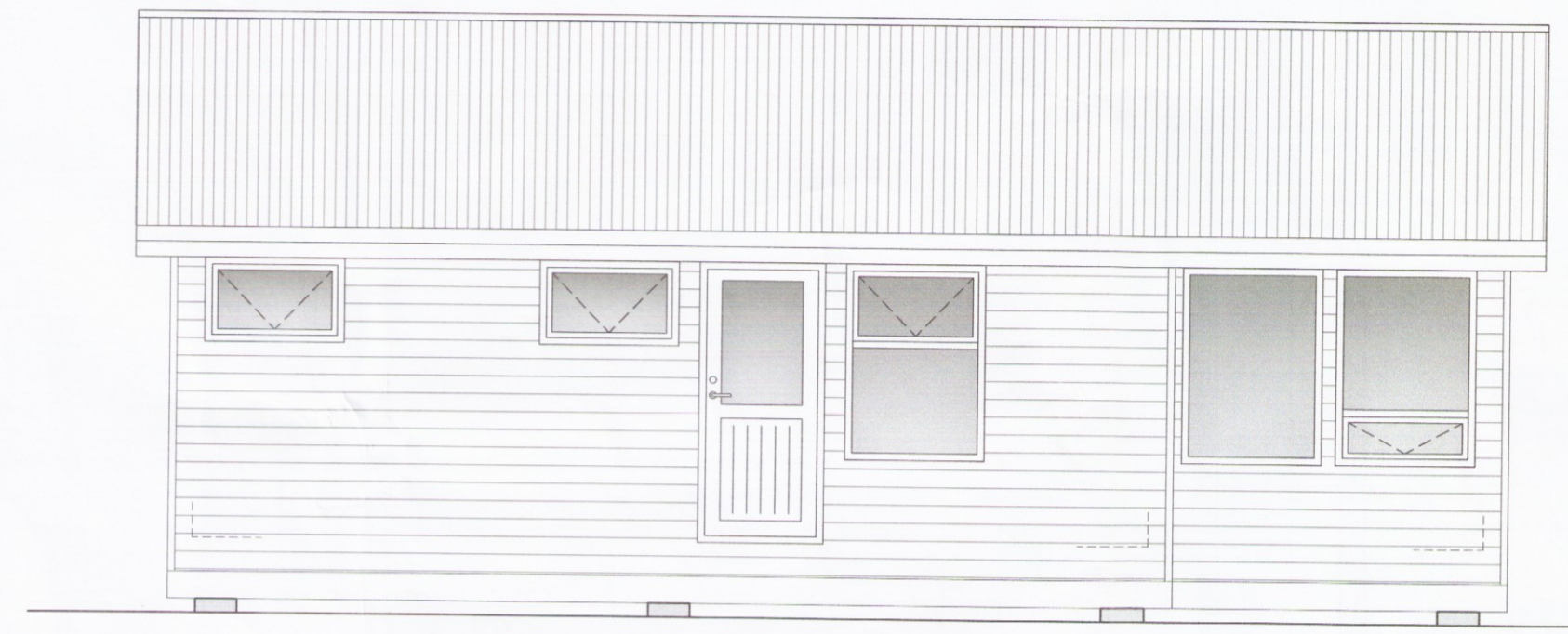
HLIÐ - 1

Umhverfis- og tæknisvið Uppsveita Samþykkt 27. maí 2010 Gunnar Byggingarfulltrúi