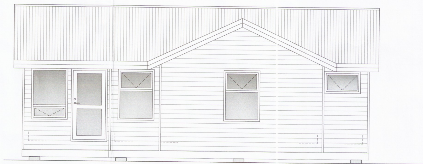
HLIÐ - 4

Útgefni: 12.05.10 GRG Frumútgáfa Útgáfa: Dagsetn: Af: Skýring: