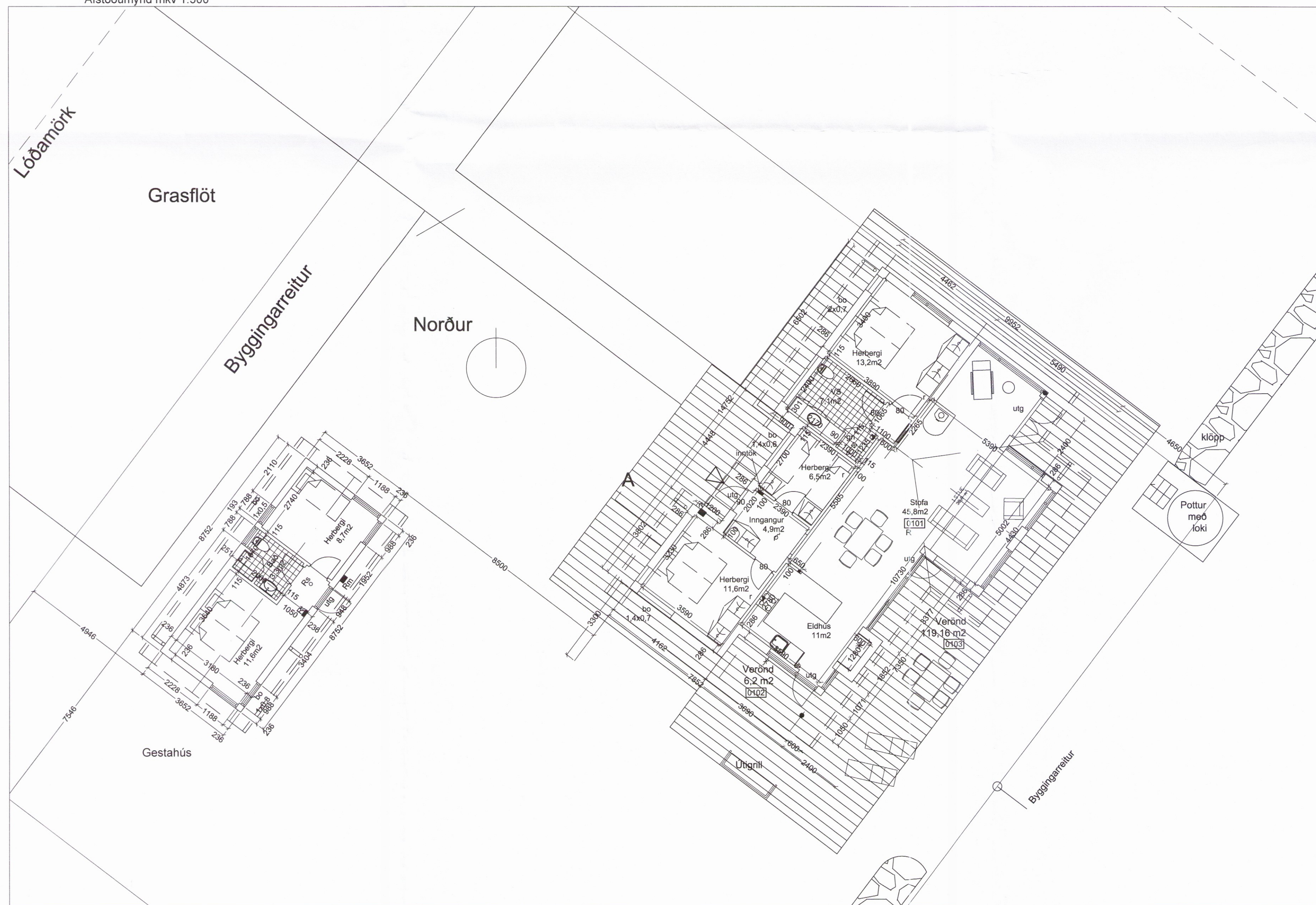
Grunnmynd mkv 1:100