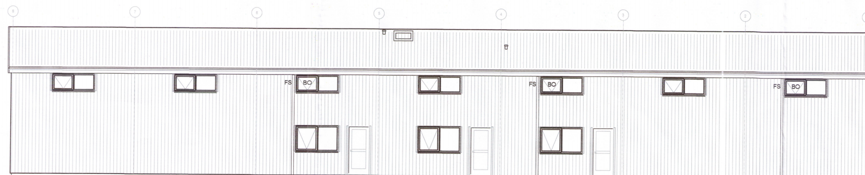
ÚTLIT AUSTURHLIÐ MKV. 1:100