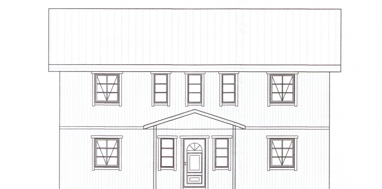
ÚTLIT NORÐUR Mkv. 1:100