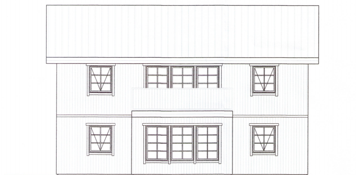
ÚTLIT SUÐUR Mkv. 1:100