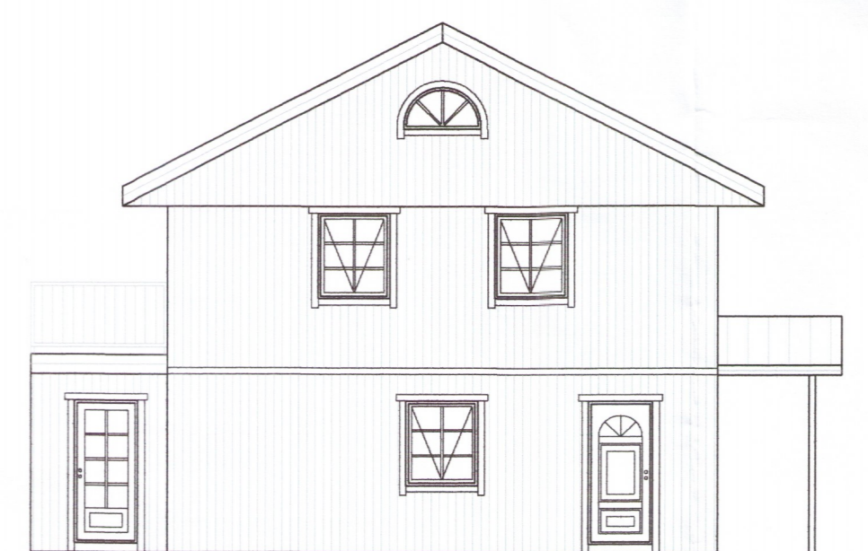
ÚTLIT AUSTUR Mkv. 1:100