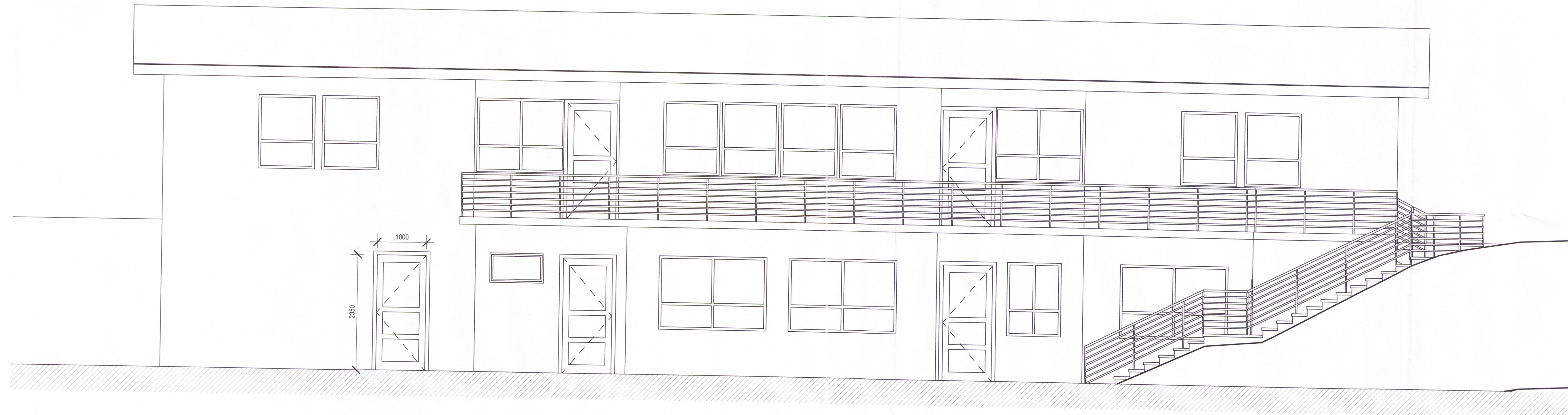
1 Framhlið VT 1 : 50