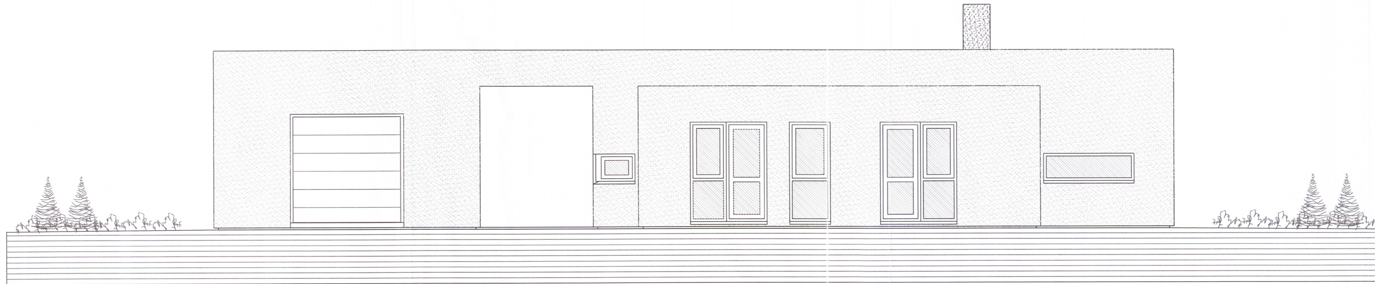
ÚTLIT NORÐUR MKV. 1:50.