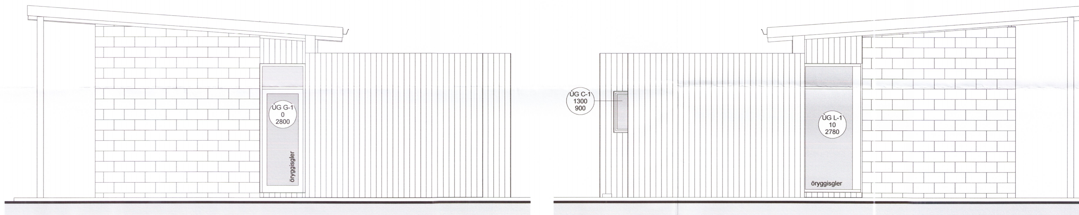
Ásýnd austur 1-50