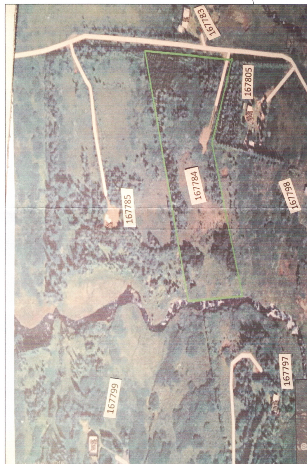
LOFTMYND AF LÓÐ