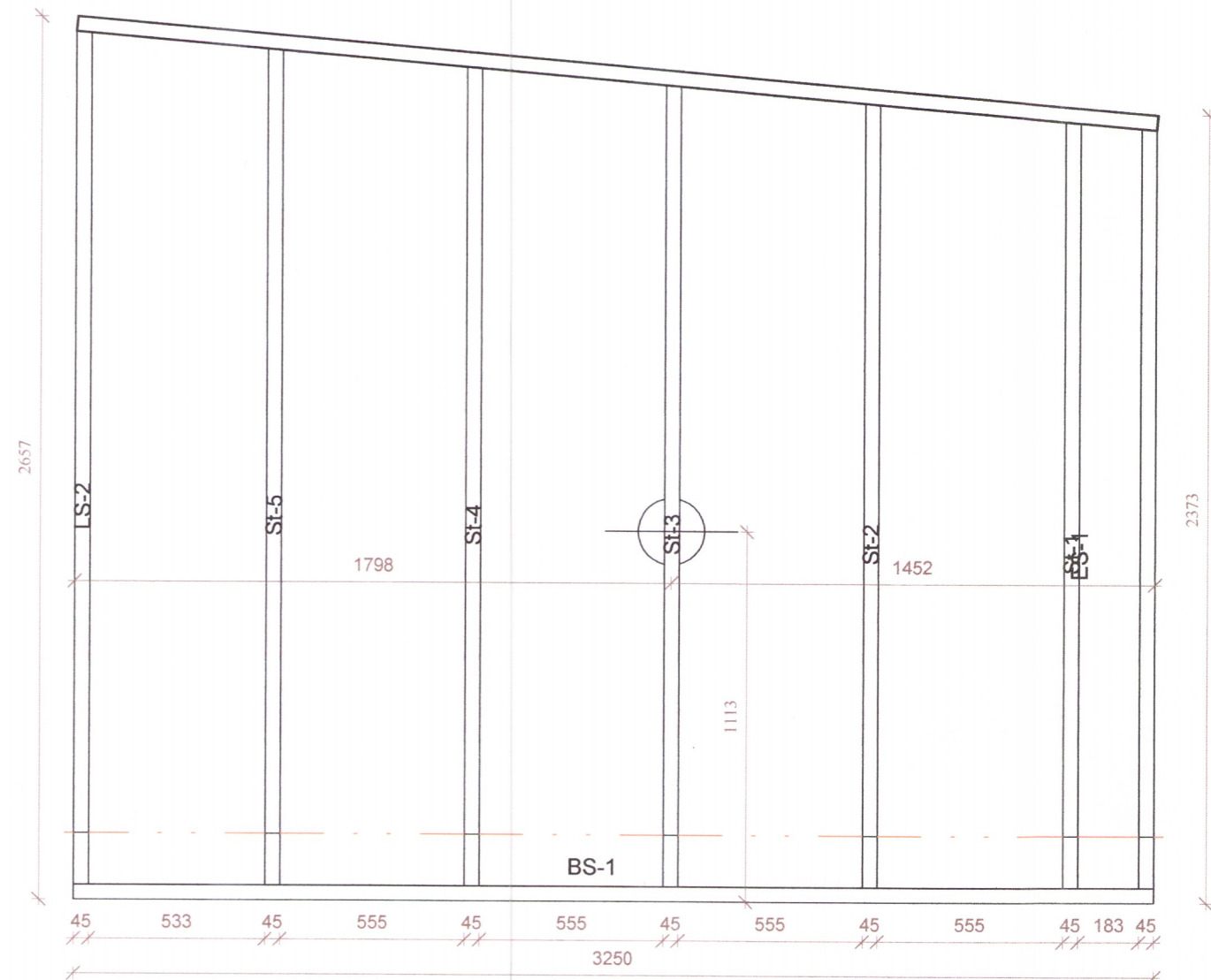
1 Mál burðareiningar veggeiningar 1 : 20