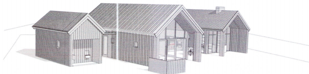
SÉÐ FRÁ HLÍÐ Á GESTAHÚS OG SUMARHÚ