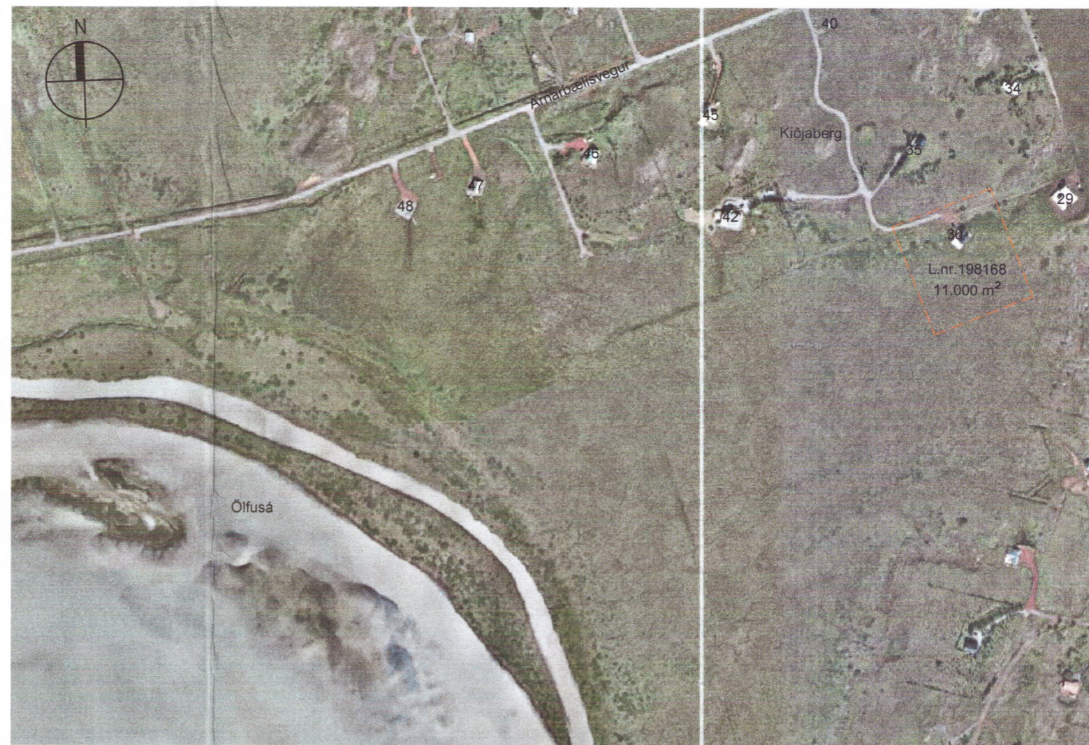
Afstaða / Loftmynd Mkv. 1:5000

Umhverfis- og tæknisvið Uppsveita Samþykkt 16. maí 2018 Þórunn Jónsdóttir Byggingarfulltrúi