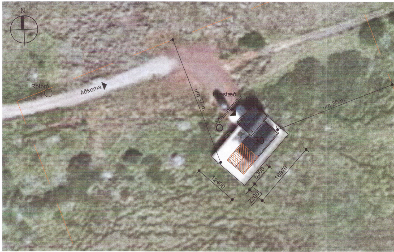
Afstaða / Loftmynd Mkv. 1:500