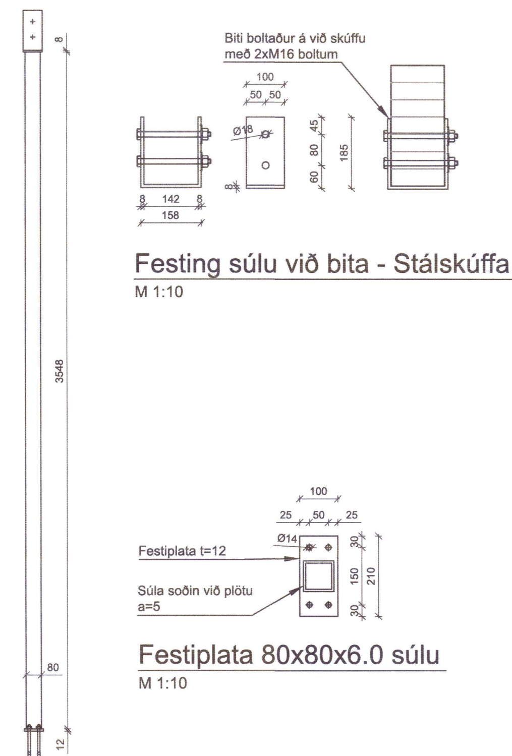
SP2 Stálprófill 80x80x6.0 M 1:20