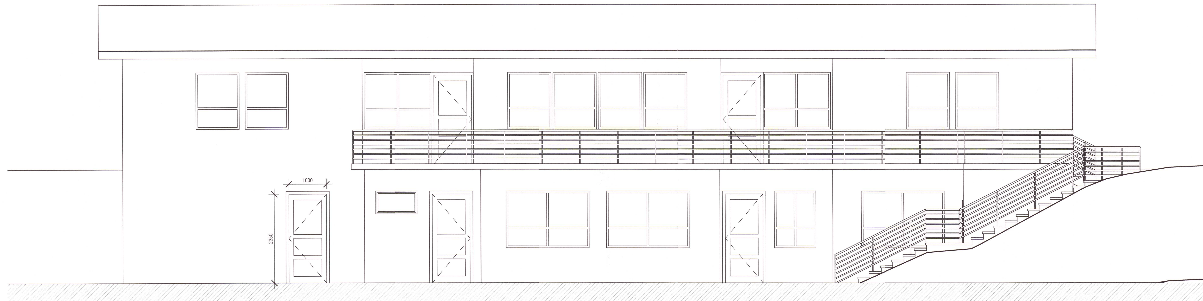
1 Framhlið VT 1 : 50