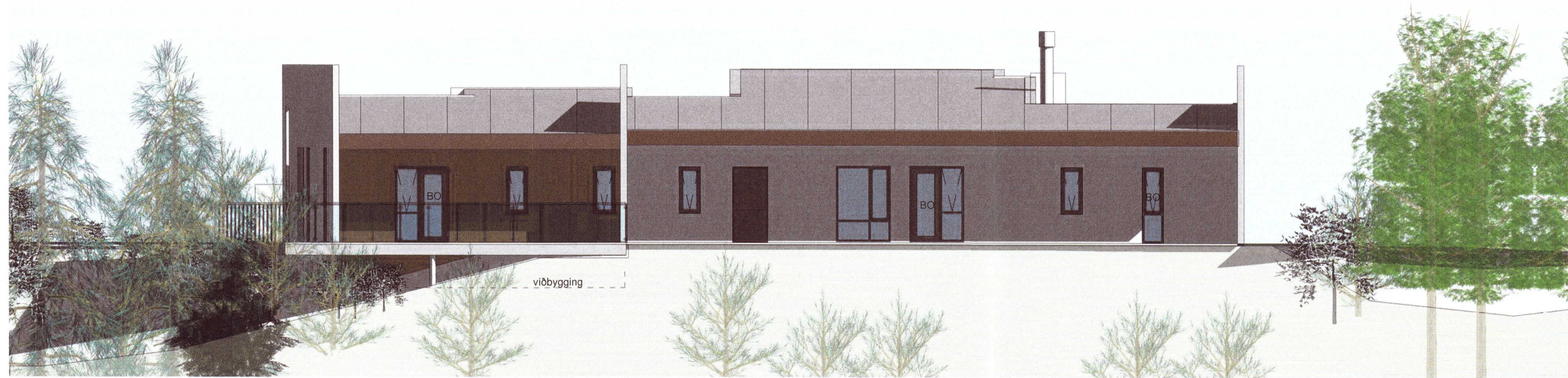
Útlit austur 1 : 100

Umhverfis- og tæknisvið Uppsveita Samþykkt 26. júní 2020 David Sigurdsson Byggingarfulltrúi