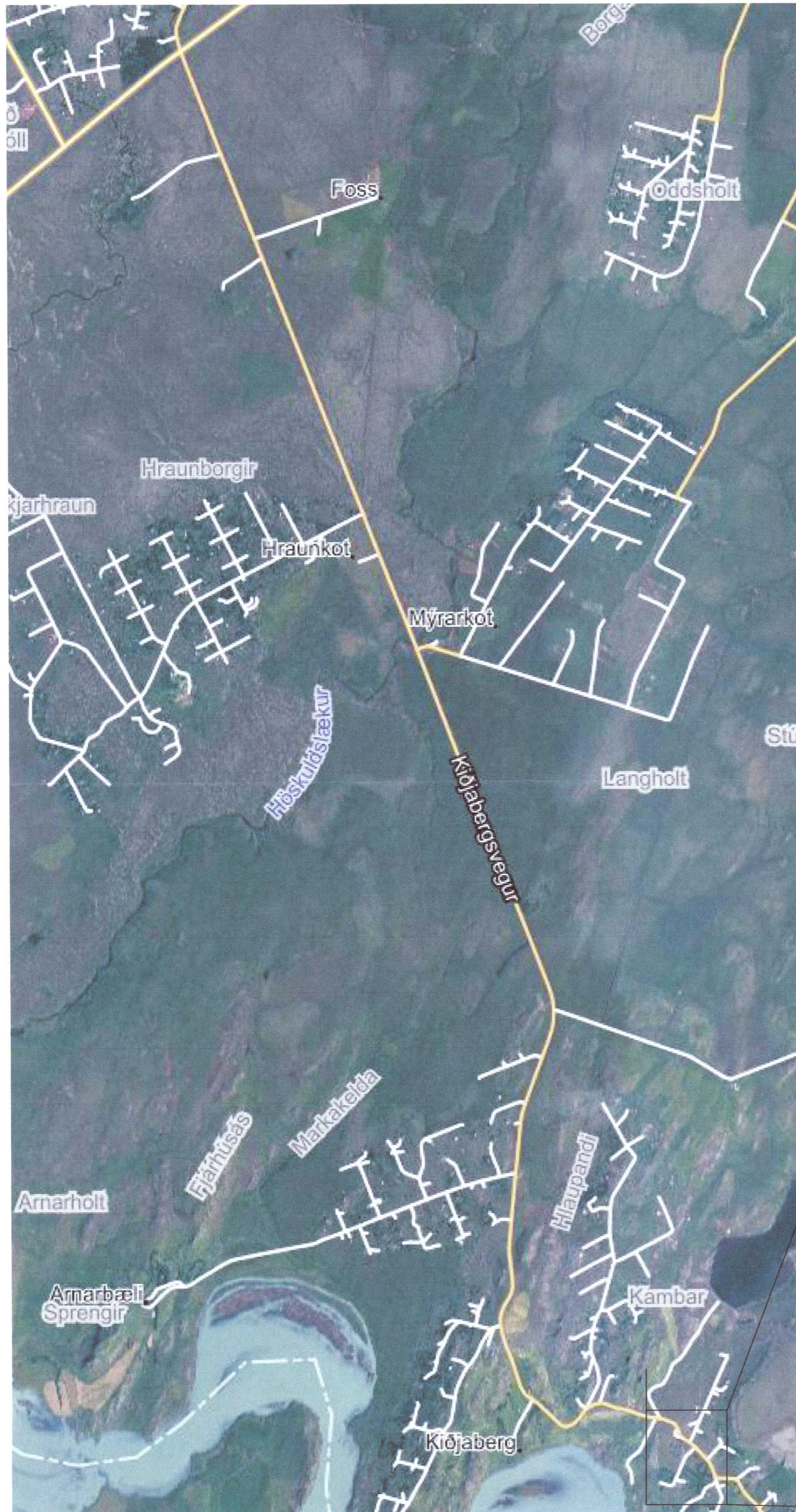
YFIRLITSMYND, EKKI Í KVARÐA