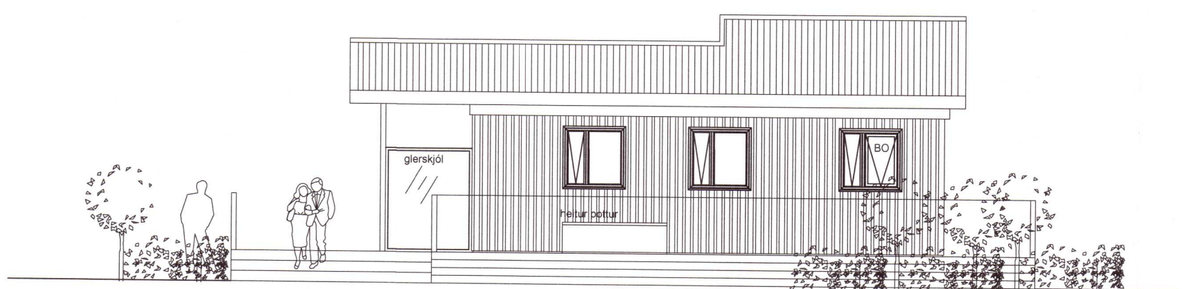
Útlit austur 1 : 100