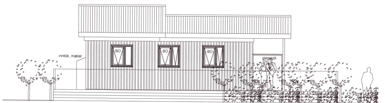
Útlit vestur 1 : 100