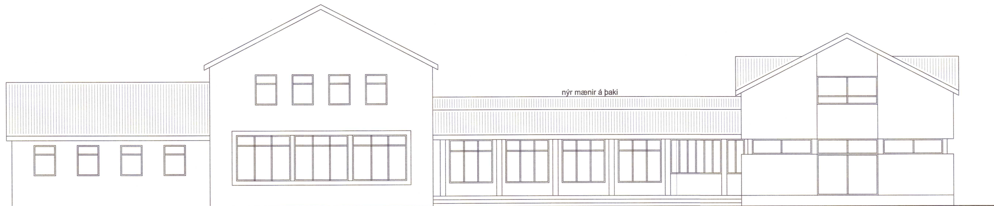
Norðurhlið eftir breytingu M 1:100

ÚTG. DAGS. ÚTGÁFUFERILL HANNAÐ TEIKN. YFIRF.