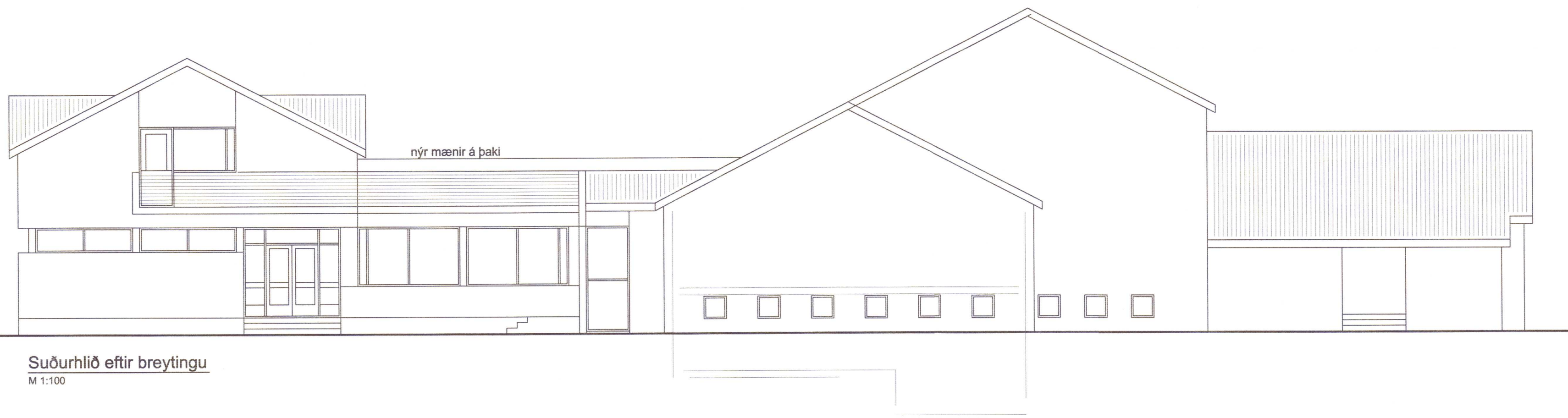
Suðurhlið eftir breytingu M 1:100