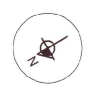
GRUNNMYND ÁBURÐARKJALLARA MKV. 1:100

NOTÁLAG OG EIGINÞYNGD: ÁLAGSTILHÖGUN ER Í SAMRÆMI VÍÐ ÍST EN 1990: 2002/NA:2010 NOTÁLAG Á NEDRIPLÖTU 4,2 kN/m² EIGIN ÞYNGD Á NEDRIPLÖTU 11,8 kN/m² VINDÁLAG: VINDÁLAG REIKNAST SAMKVÆMT ÍST EN 1991-1-4: 2005/NA:2010 GRUNNGILDI VINDÁLAGS ER 1,70 kN/m² SNJÓÁLAG: SNJÓÁLAG REIKNAST SAMKVÆMT ÍST EN 1991-1-3: 2003/NA:2010 GRUNNGILDI SNJÓÁLAGS ER 2,1 kN/m² GRUNDUN: GRUNDUN SAMKVÆMT ÍST EN 1997-1:2004/NA:2010 GRUNDAD ER Á STEYPTAR UNDIRSTÖÐUR MESTA ÁLAG Á UNDIRSTÖÐU ER MINNA EN 0,4 MN/m² JARÐSKJÁLFTAALAG: JARÐSKJÁLFTAALAG REIKNAST SAMKVÆMT ÍST EN 1998-1:2004/NA:2010 HÖNNUNARHROÐUN ER 0,5g