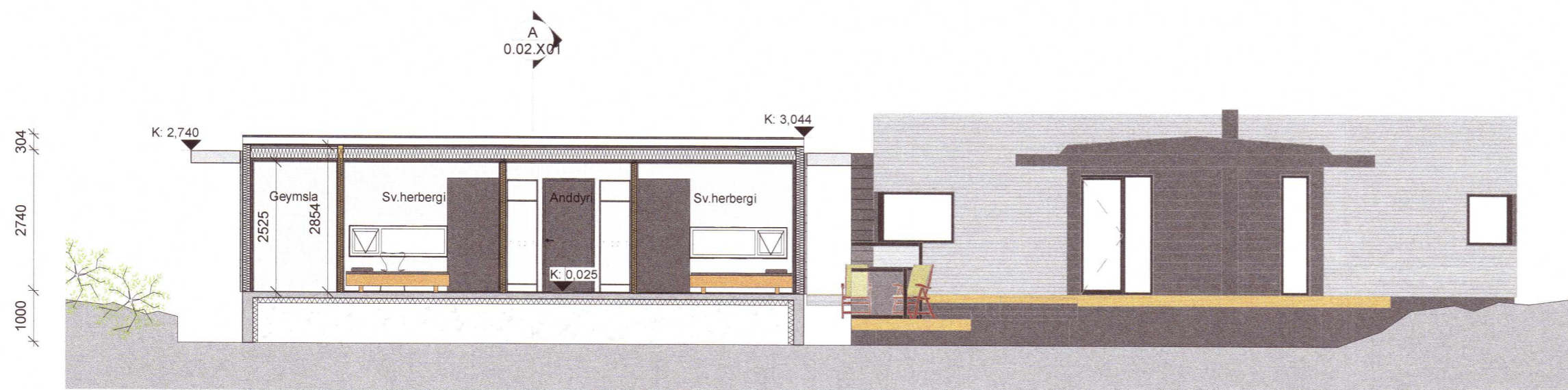
Snið B-B 1 : 100