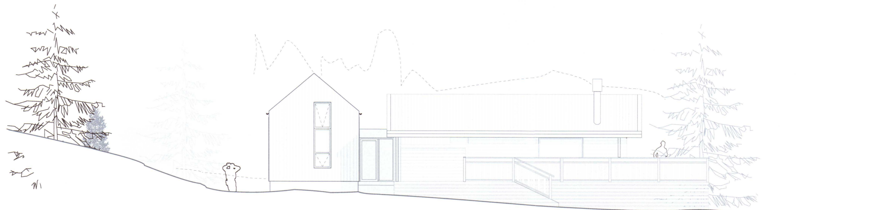
3 Norðurhlíð 1:100

Umhverfis- og tæknisvið Úppsveita Samþykkt 18. des. 2019 Douð Sigurði Byggingarfulltrúi