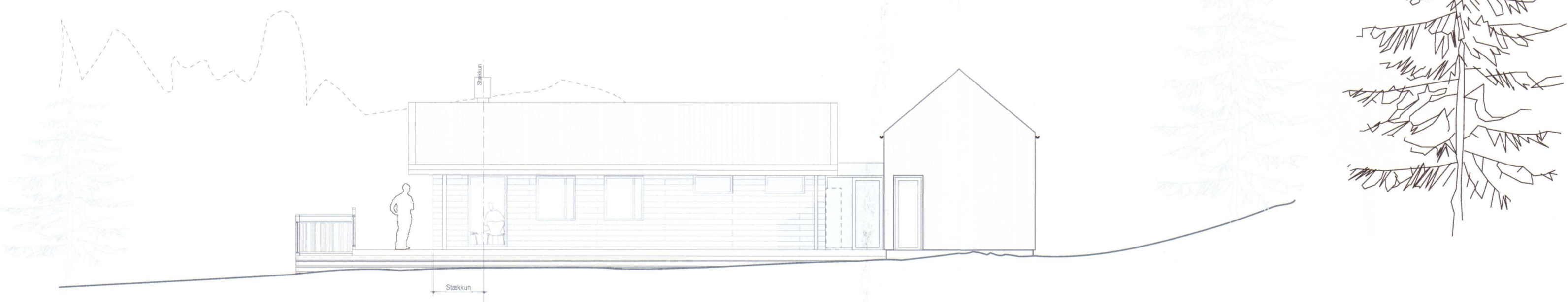
5 Suðurhlíð 1:100