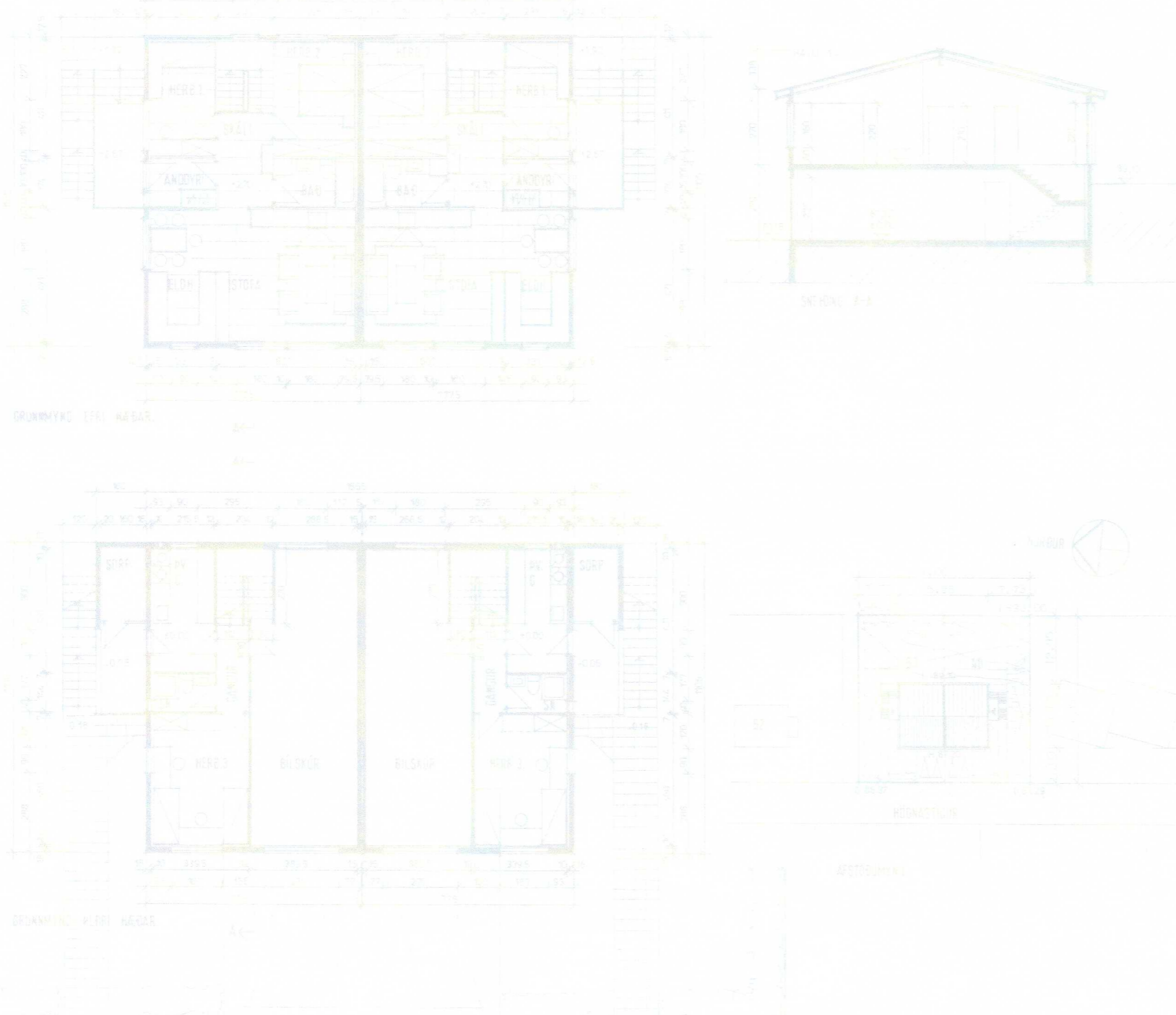
Teikningar af húsinu fyrir breytingu