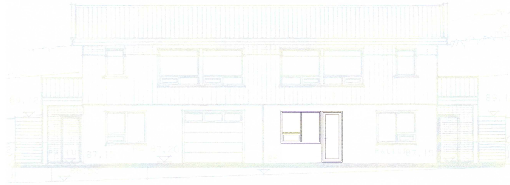
Útlit eftir breytingu M 1:100

(sjá skráningartöflu) Brúttóflatarmál íbúðar ..... 166,5m 2 Birt flatarmál íbúðar ..... 166,5m 2 Brúttórúmmál íbúðar ..... 540,3m 3