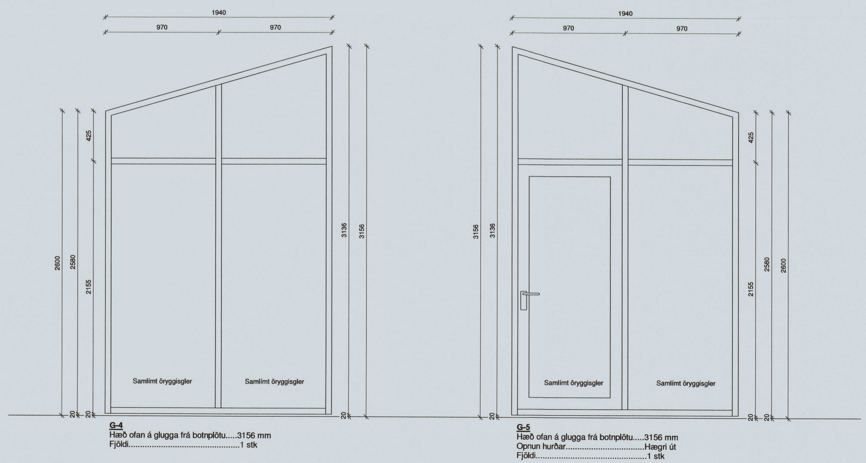
G-4 Hæð ofan á glugga frá botnplötu.....3156 mm Fjöldi.....1 stk