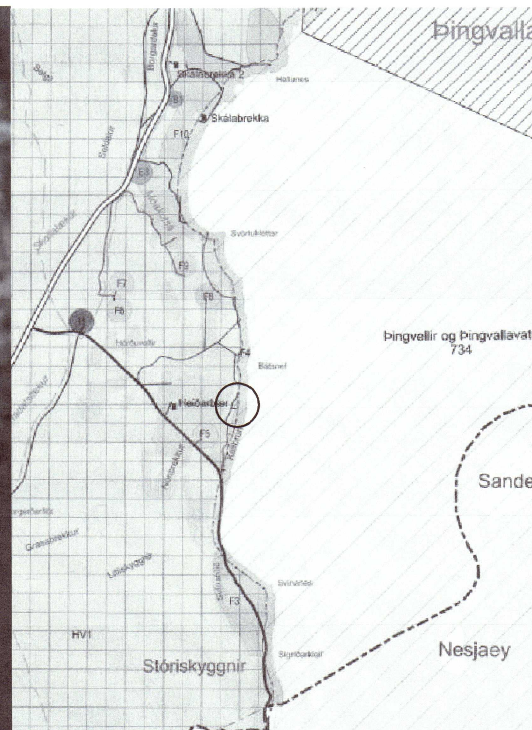
Yfirlitsmynd úr Aðalskipulagsupprætti Bláskógabyggðar 2015-2027 (Ekki í kvarða)