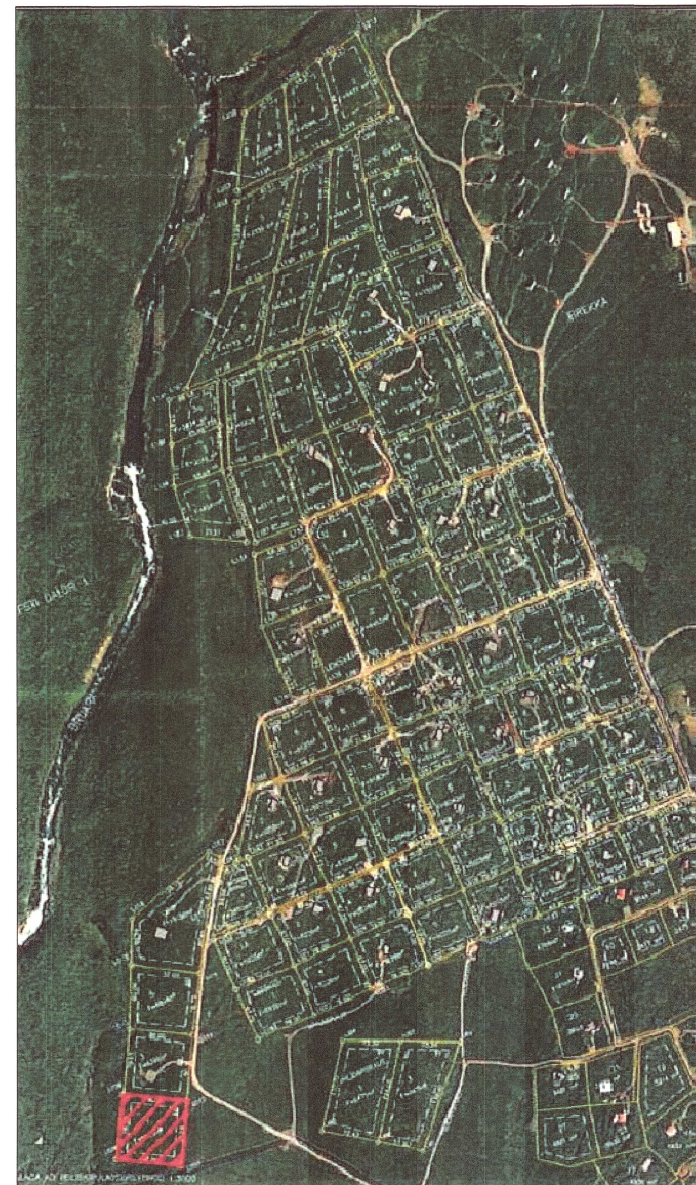
Yfirlitsmynd, lóð merkt með rauðu