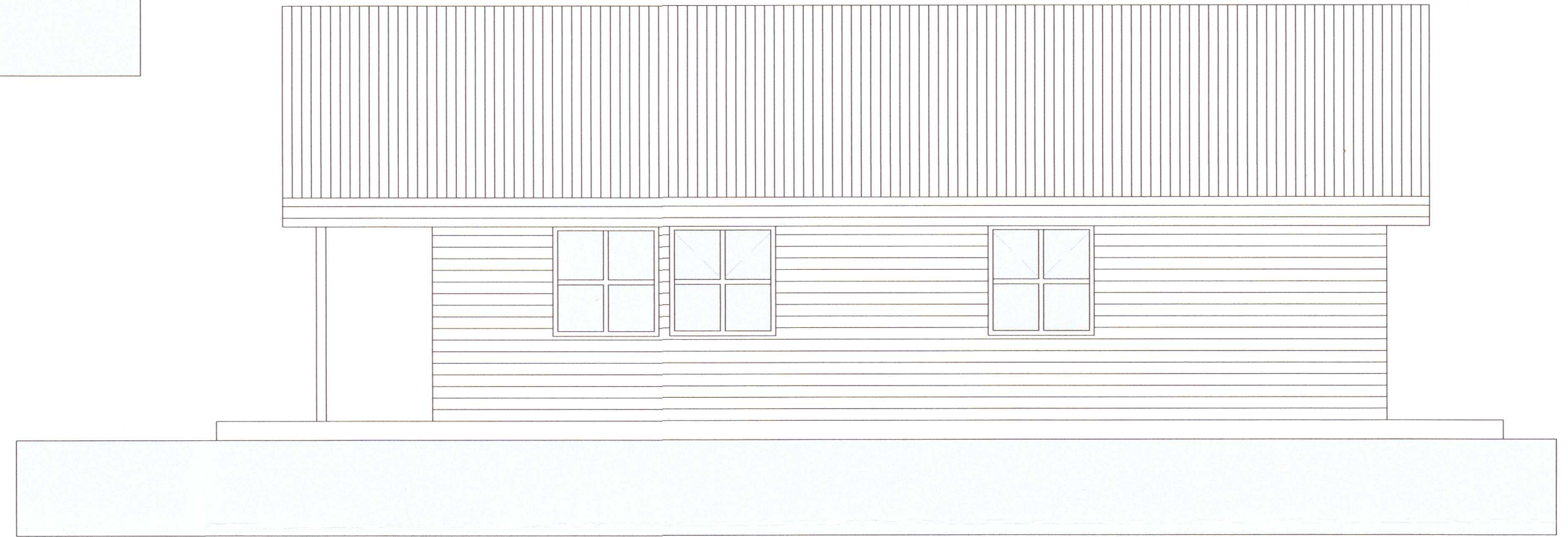
Austlæg hlið Mkv. 1:50