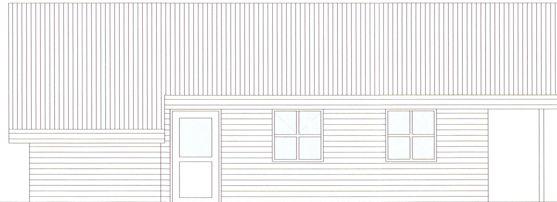
Vestlæg hlið Mkv. 1:50