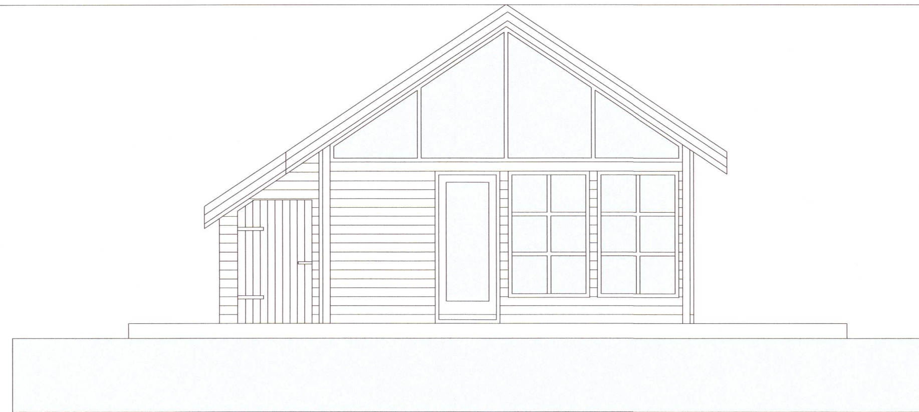
Suðlæg hlið Mkv. 1:50