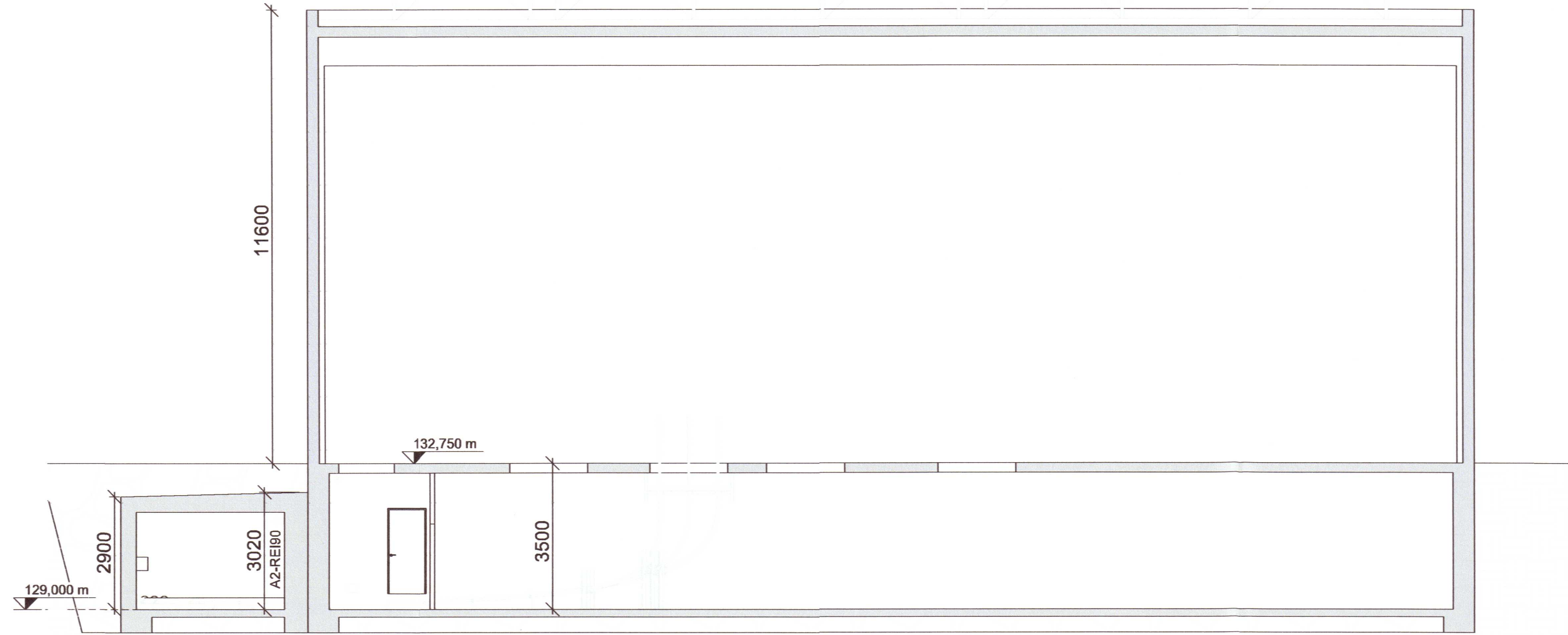
Tengivirki - Snið B-B 1 : 100

VIÐBYGGING NEDANJARÐAR ← NÚVERANDI MANNVIRKI