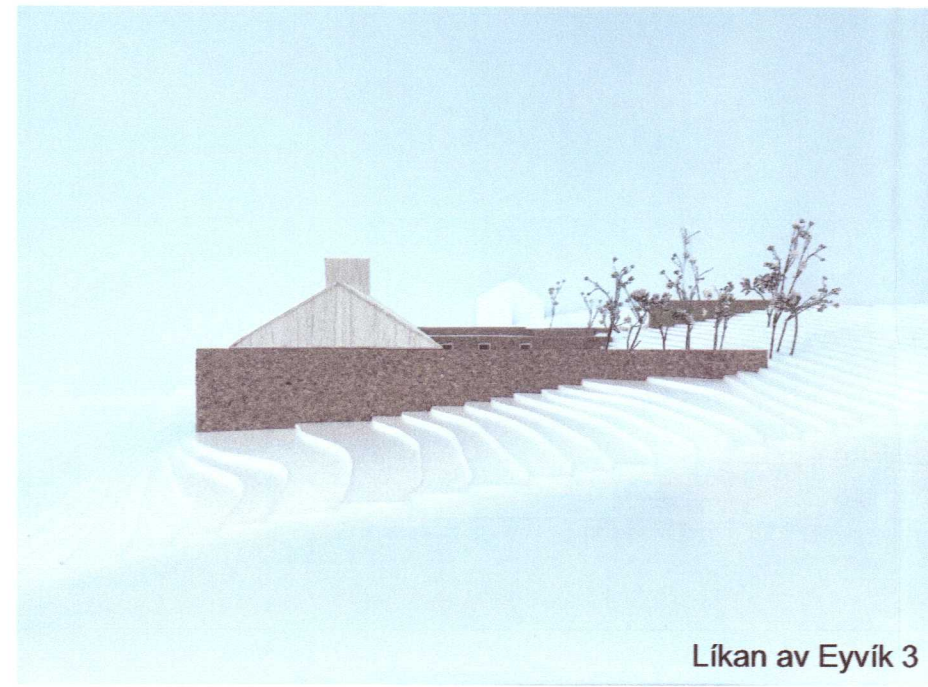
Líkan av Eyvík 3