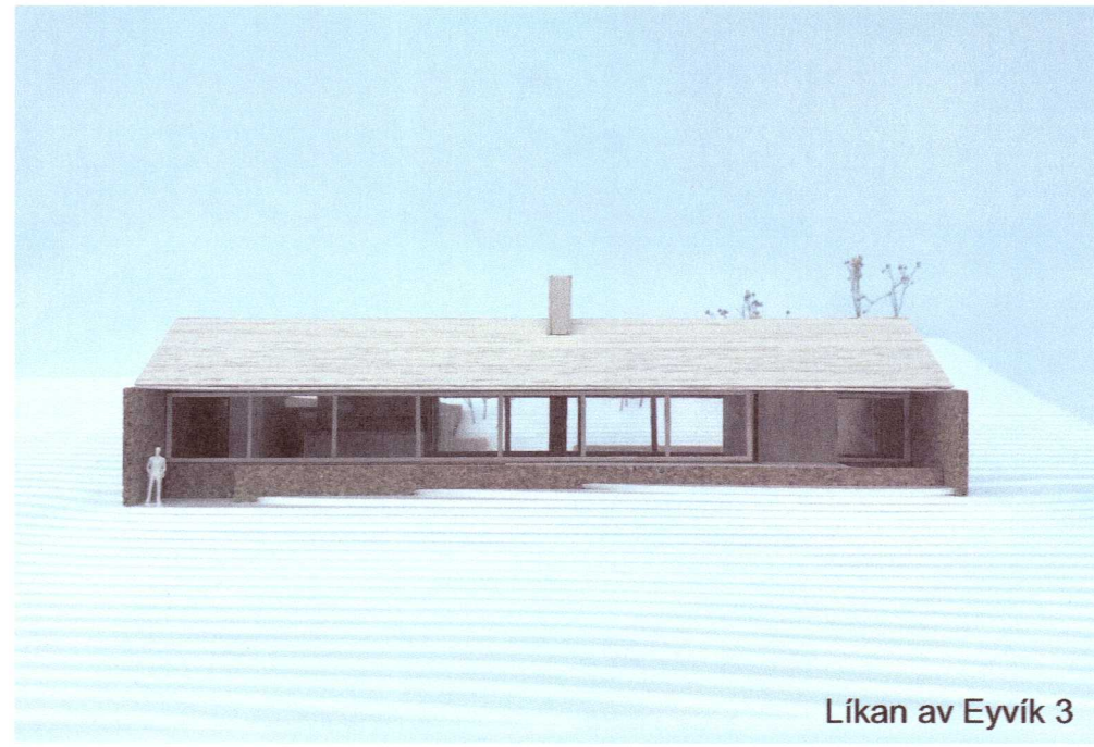
Líkan av Eyvík 3