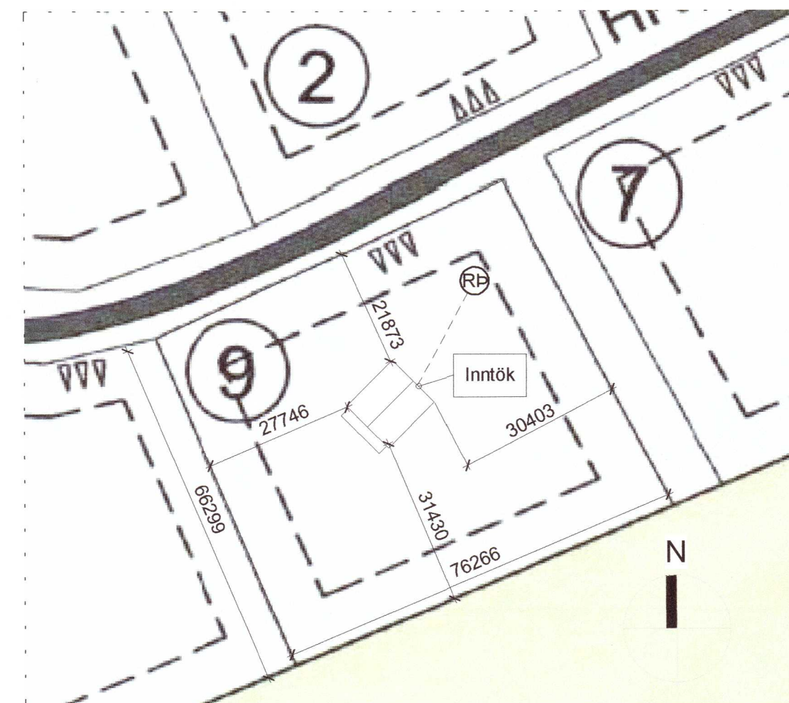
2 Afstöðumynd 1:1000

Stærðir: Grunnflötur húss er 86,3 m². Rúmmál húss er 279,378 m³ Stærð lóðar er 5001m² Nýtingarhlutfall er 0,017257