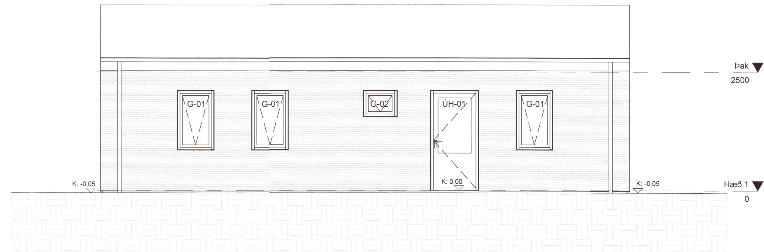
- Norður 1 : 50