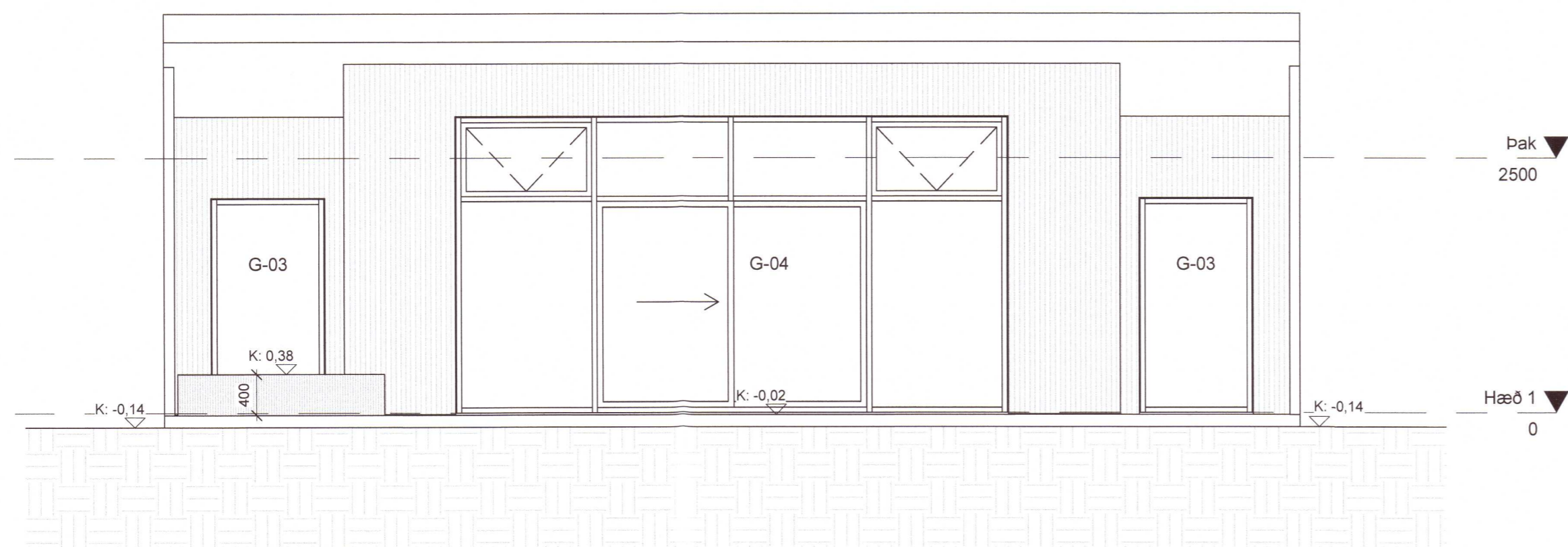
- Suður 1 : 50