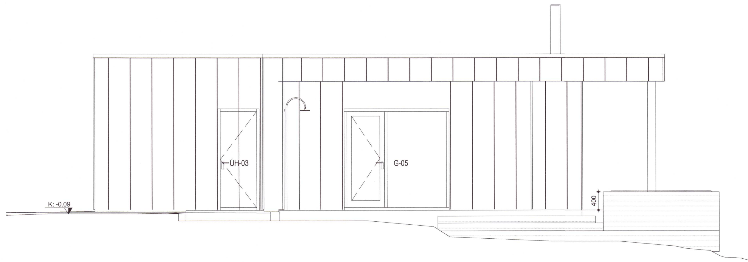
Vesturhlíð Copy 1