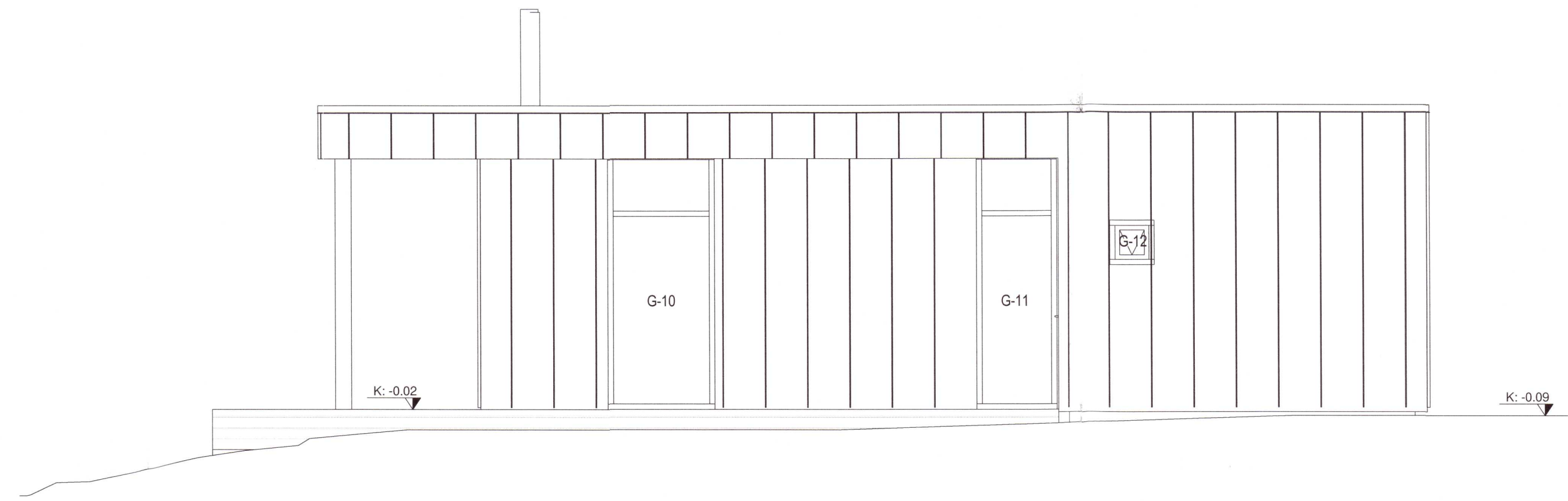
Austurhlíð Copy 1