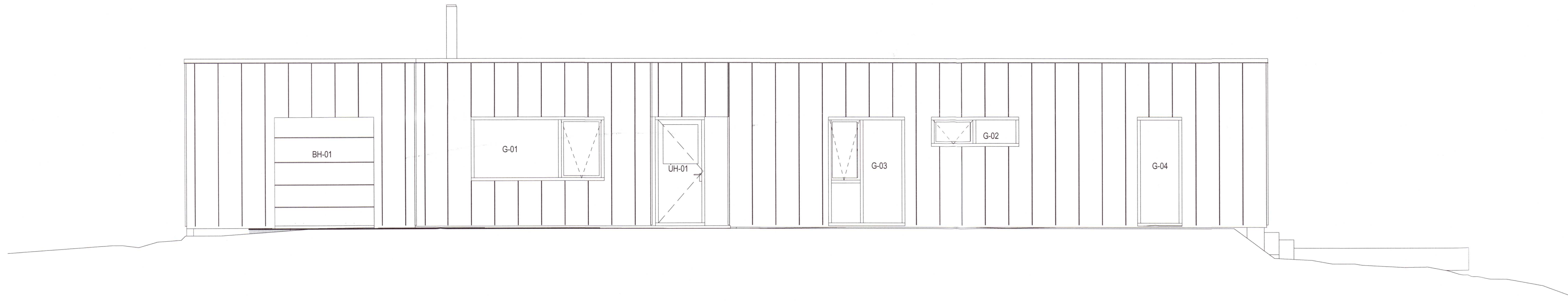
Norðurhlíð Copy 1