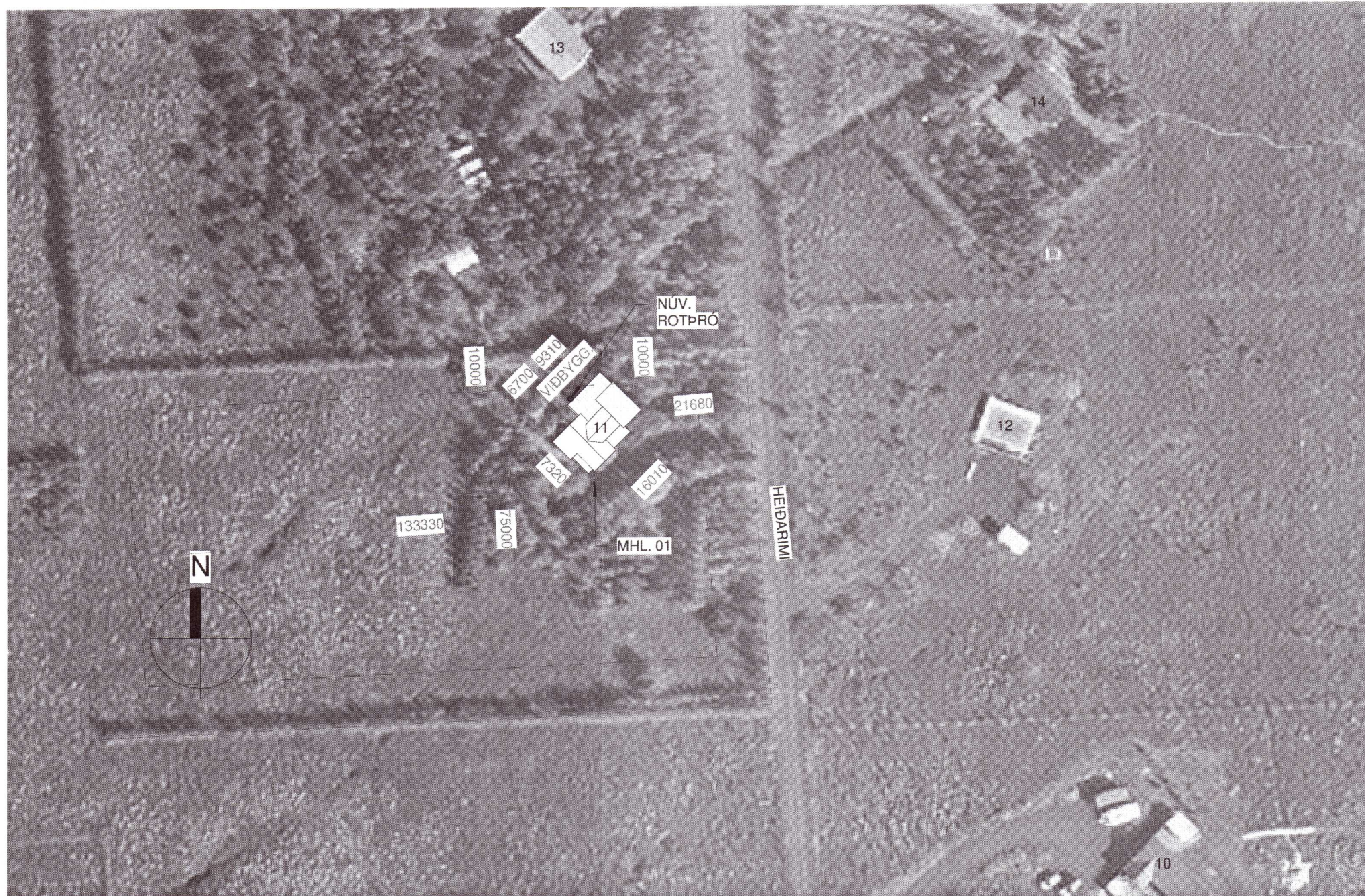
Afstöðumynd 1 : 1000