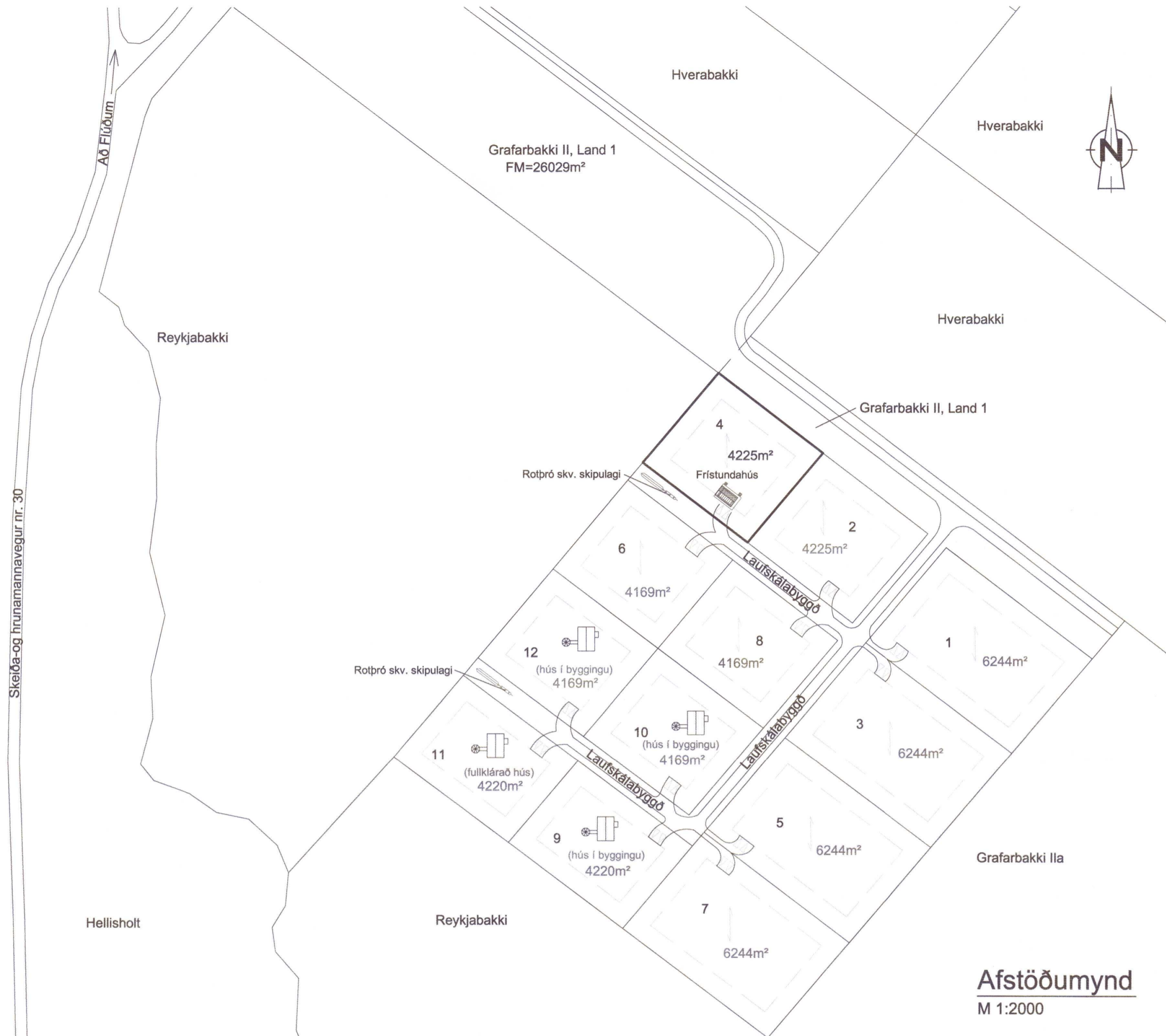
Afstöðumynd M 1:2000

ÚTG. DAGS. ÚTGÁFUERILL HANNAD TEIKN. YFIRF.