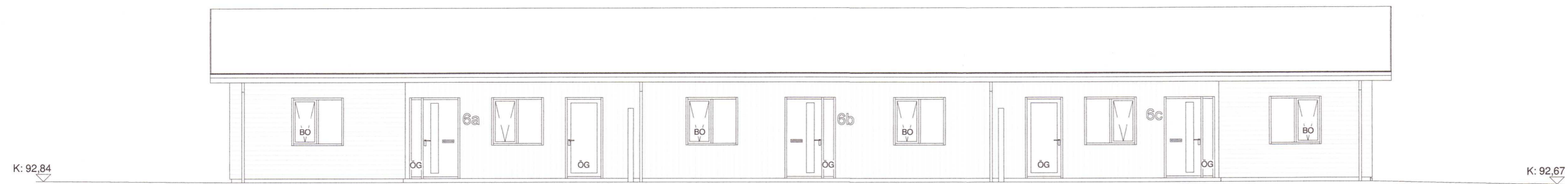
Suðaustur 1 : 100

Umhverfis- og tæknisvið Uppsveita Samþykkt 15. júní 2022 David Þorsteinsson Byggingarfulltrúi