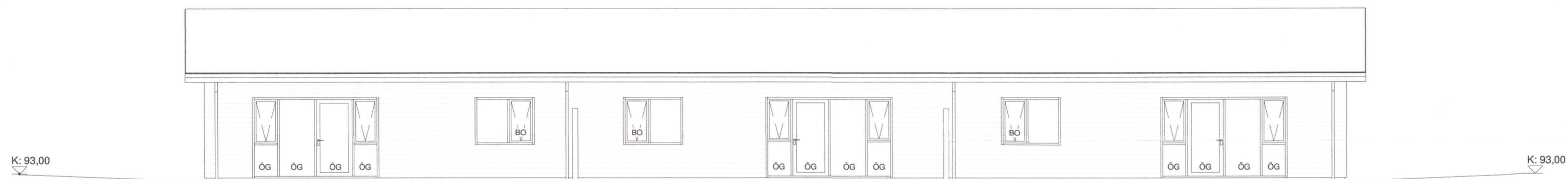
Norðvestur 1 : 100