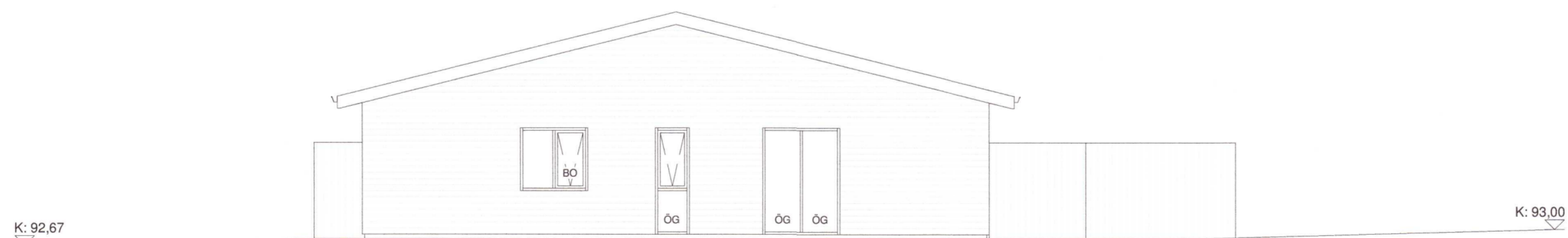
Norðaustur 1 : 100