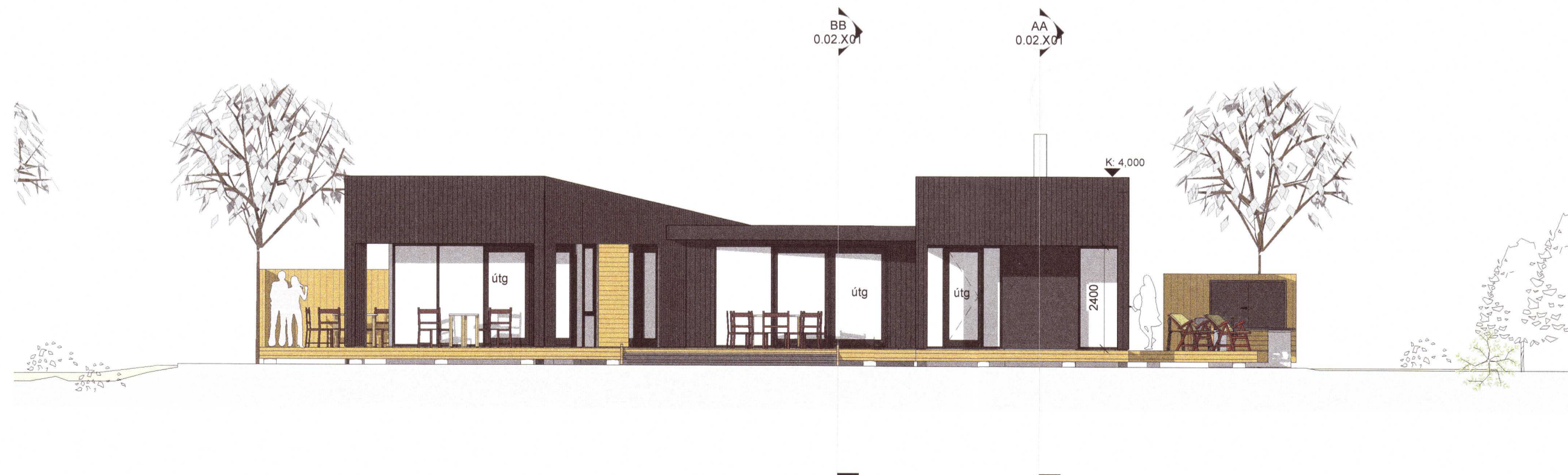
ÚTLIT AUSTUR 1 : 100