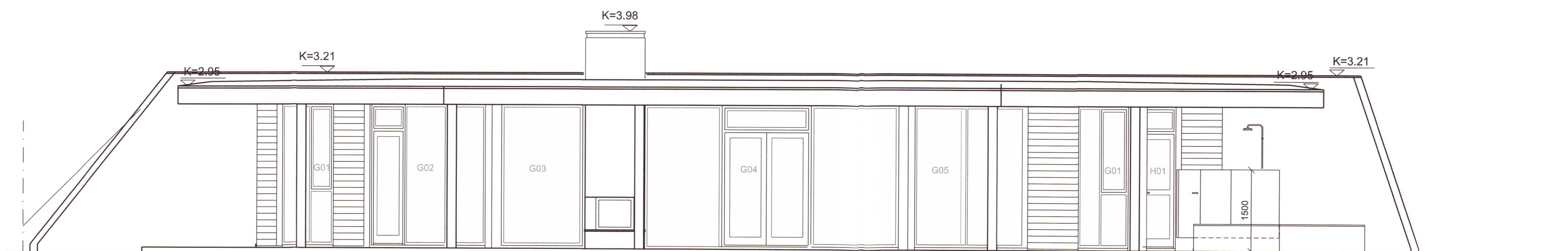
1 ÚTLIT 1:50 vestur