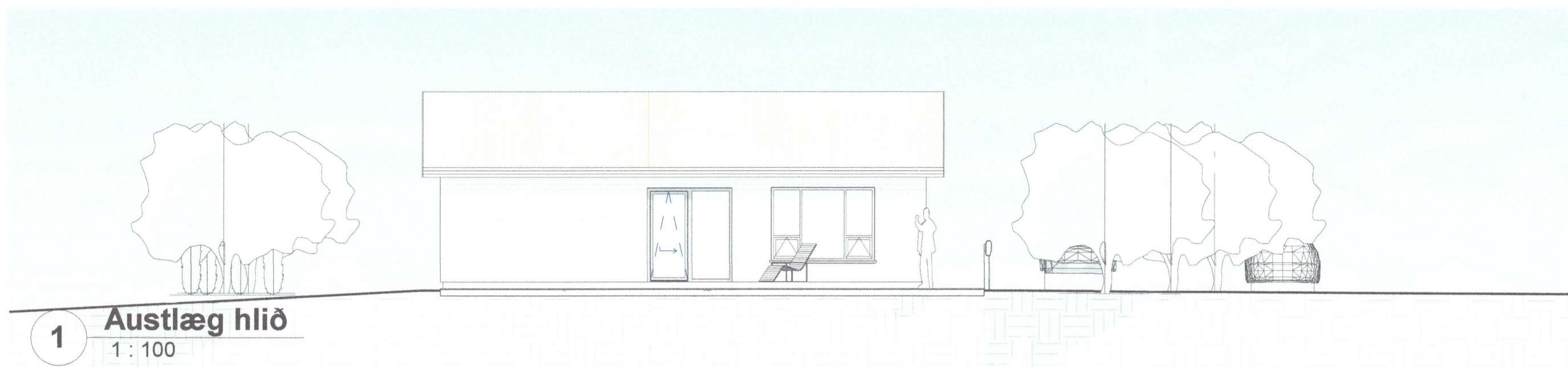
1 Austlæg hlið 1 : 100

Umhverfis- og tæknisvið Uppsveita Samþykkt 07. okt. 2020 David Sæmundsson Byggingarfulltrúi