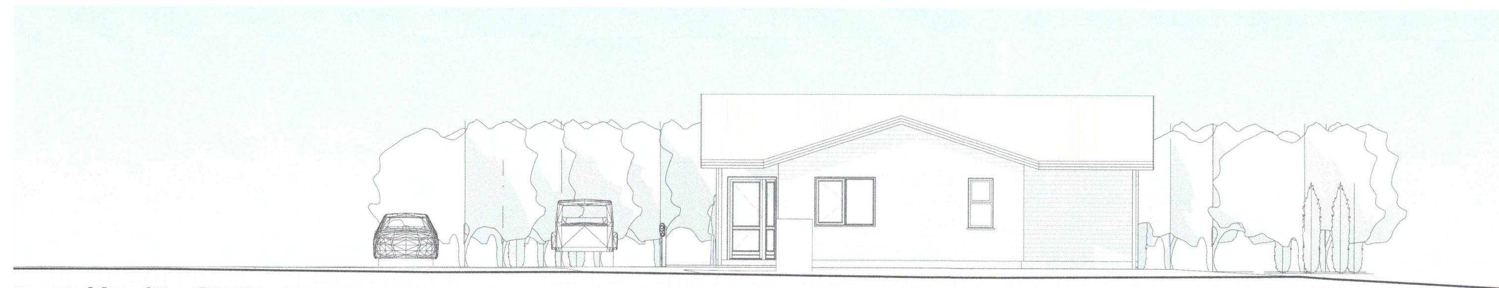
4 Vestlæg hlið 1 : 100