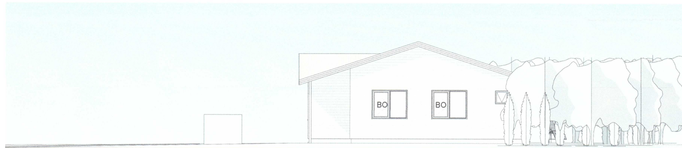
3 Suðlæg hlið 1 : 100