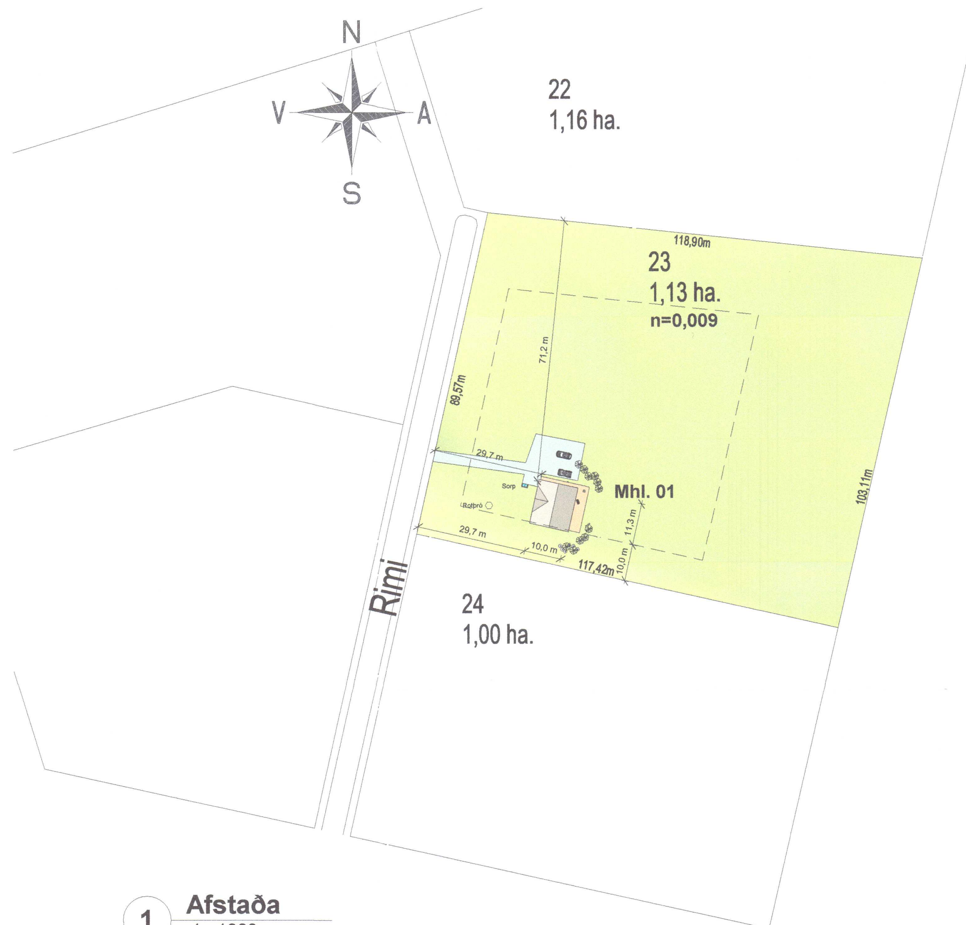
1 Afstaða 1 : 1000

Umhverfis- og tæknisvið Uppsveita Samþykkt 07. okt. 2020 Samuel Smári Hreggviðsson Byggingarfulltrúi