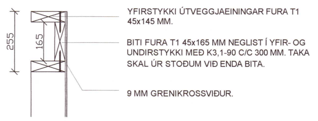
Snið 4 - 1:10