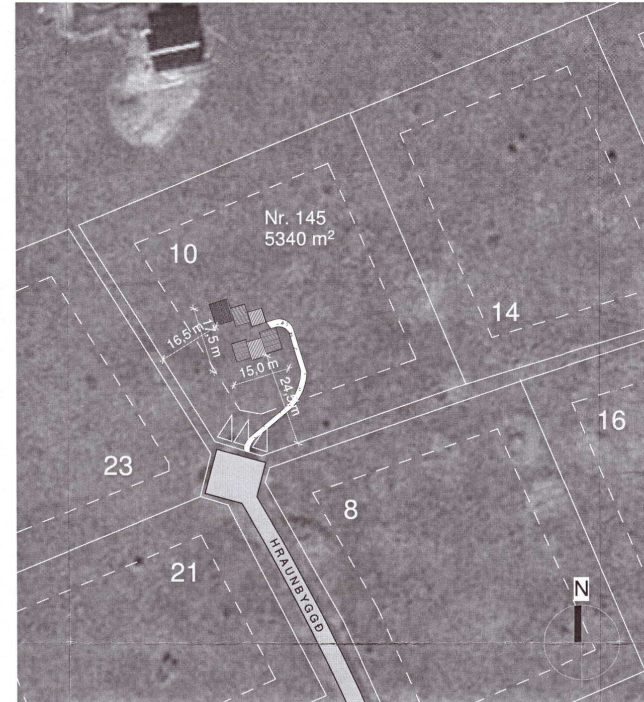
Afstöðumynd 1 : 1000