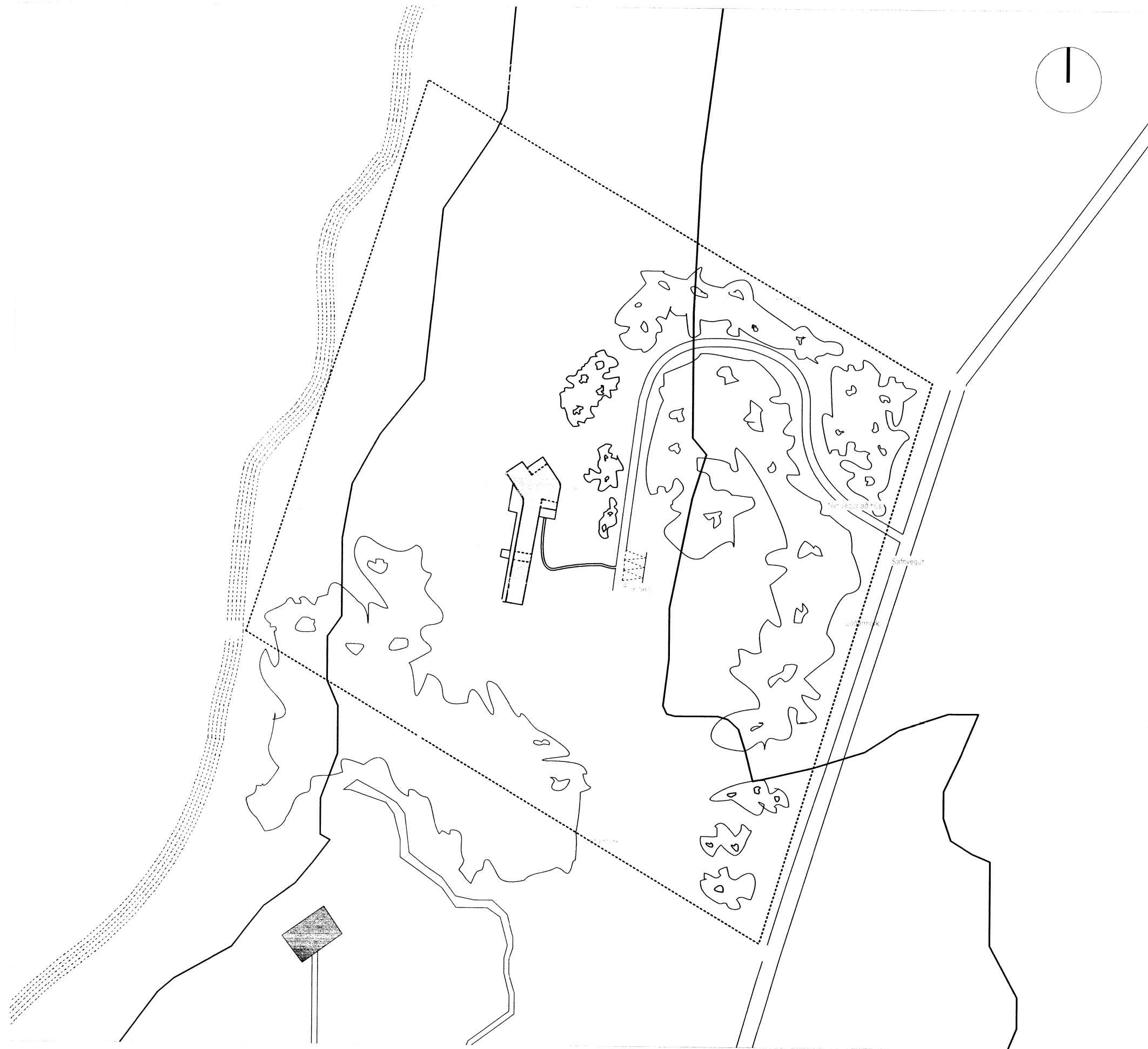
1 AFSTÖÐUMYND mkv: 1:1000