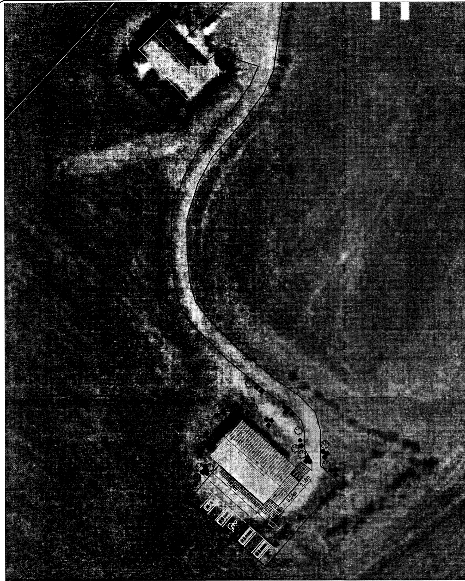
AFSTÖÐUMYND - 1:500

BRUNAVARNIR Í BYGGINGUNNI: BRUNAKRAFA VEGGJA MILLI HERBERGJA SKAL VERA EINS OG FRAM KEMUR Á GRUNNMÝNDUM. ÞAKKLÆÐNING SKAL VERA Í FLOKKI 1. KLÆÐNING Í FLOKKI 1. Í HVERJU HERBERGI SKAL VERA BJÖRGUNAROP. KOMA SKAL FYRIR REYKSKYNJURUM Í BYGGINGUNNI Í SAMRÆMI VÍÐ ÞAÐ SEM FRAM KEMUR Á GRUNNMÝNDUM.