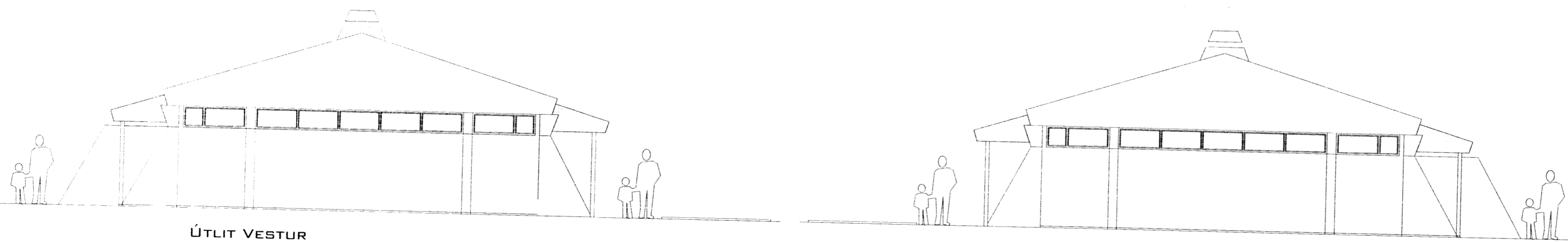
ÚTLIT VESTUR MKV 1:100