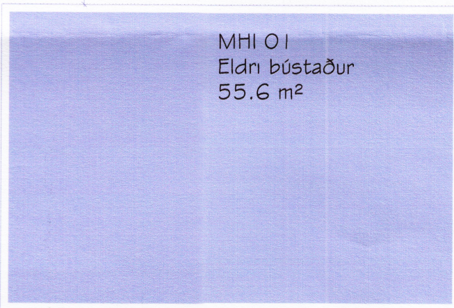
MHI O1 Eldri bústaður 55.6 m 2