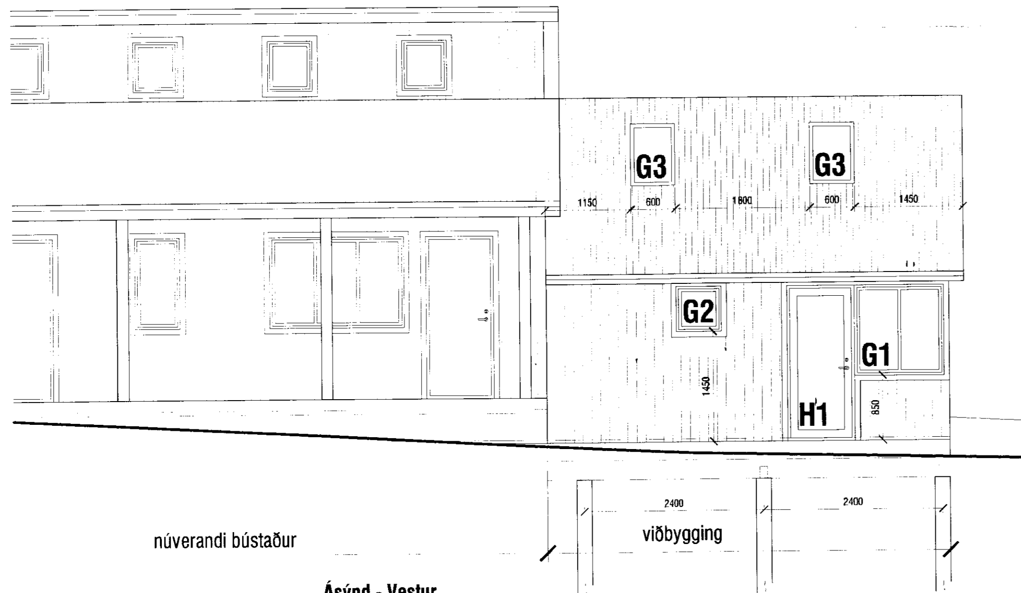
Ásýnd - Vestur mkv. 1:50

MÓTTEKIÐ 04 FEB. 2010 Byggingafrútrúi uoþev. Ármessýslu og Flóotr.