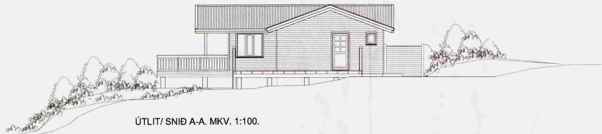
ÚTLIT/ SNID A-A. MKV. 1:100.

Samþykkt 19. AUG. 2008 Alþingi Byggingarfulltrúi uppveita Ámessýslu