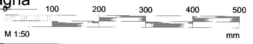
Grunnmynd neysluvatnslagna M 1:50

K:\2012\12028-Vinaminni_Viðbygging\Teikningar-teikningaskrá\Lagnir\12028-31.dwg