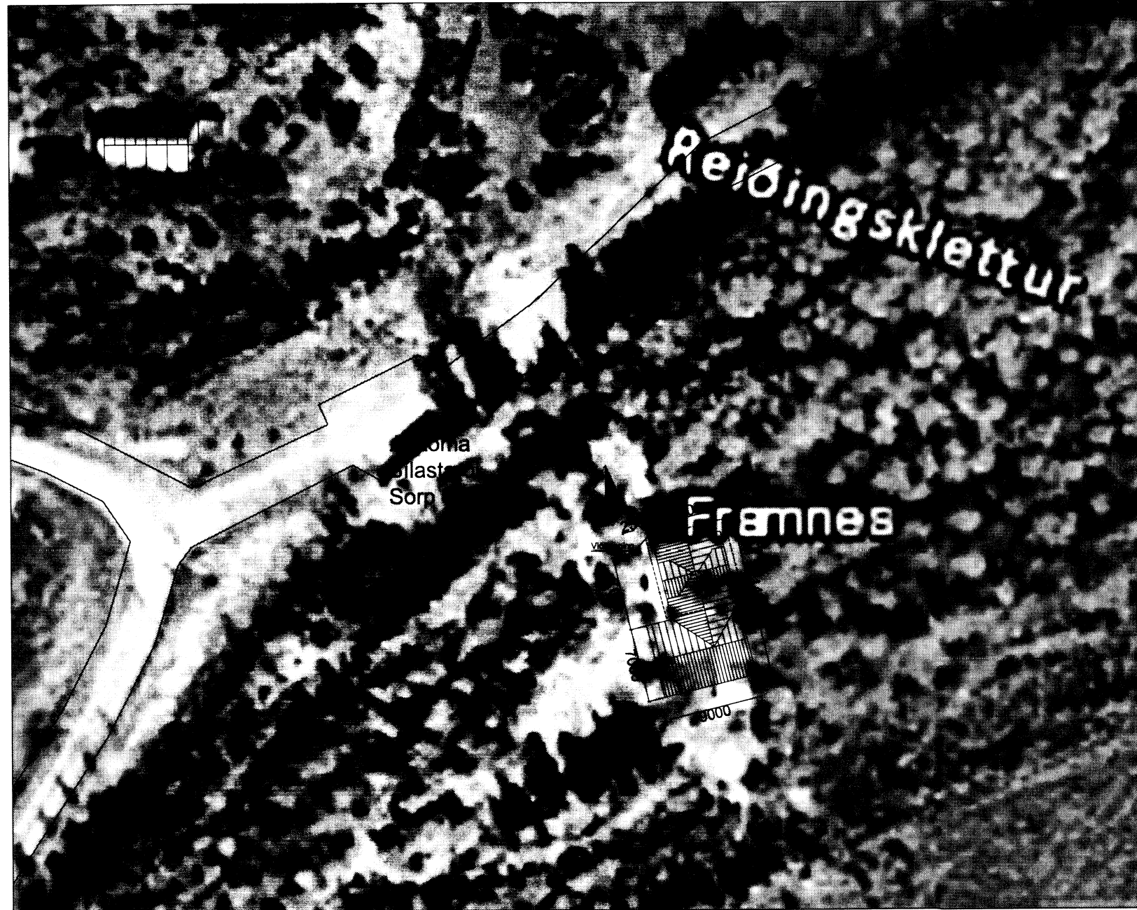
1 Afstöðmynd 1: 500