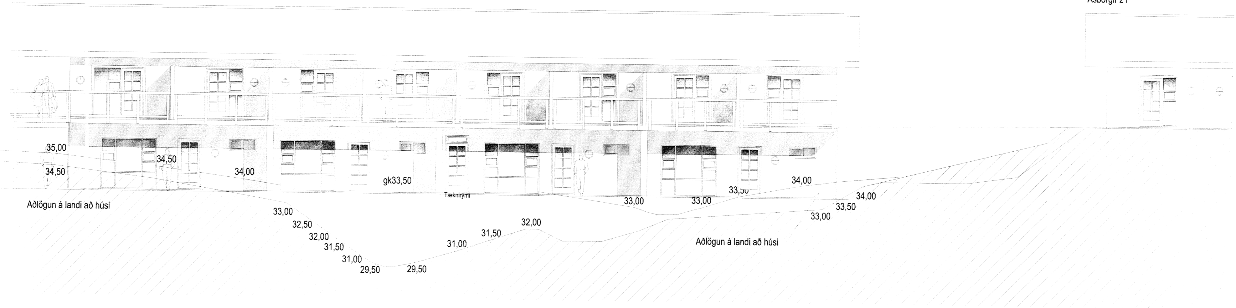
Útlit vestur 1:100