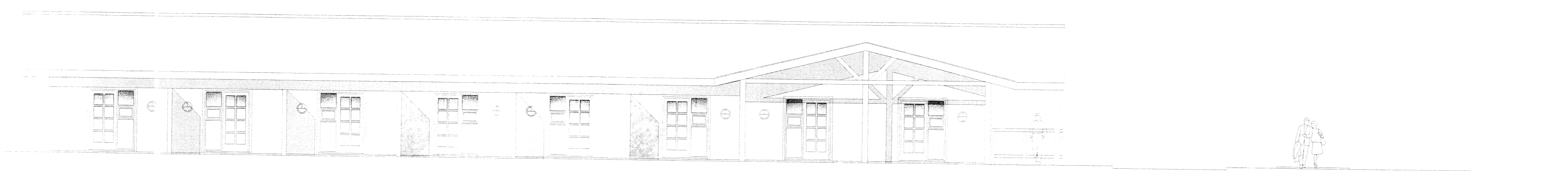
Útlit austur 1:100

Ólafur Þorsteinsson Ög. Degr. Skýsl. Ög. at.